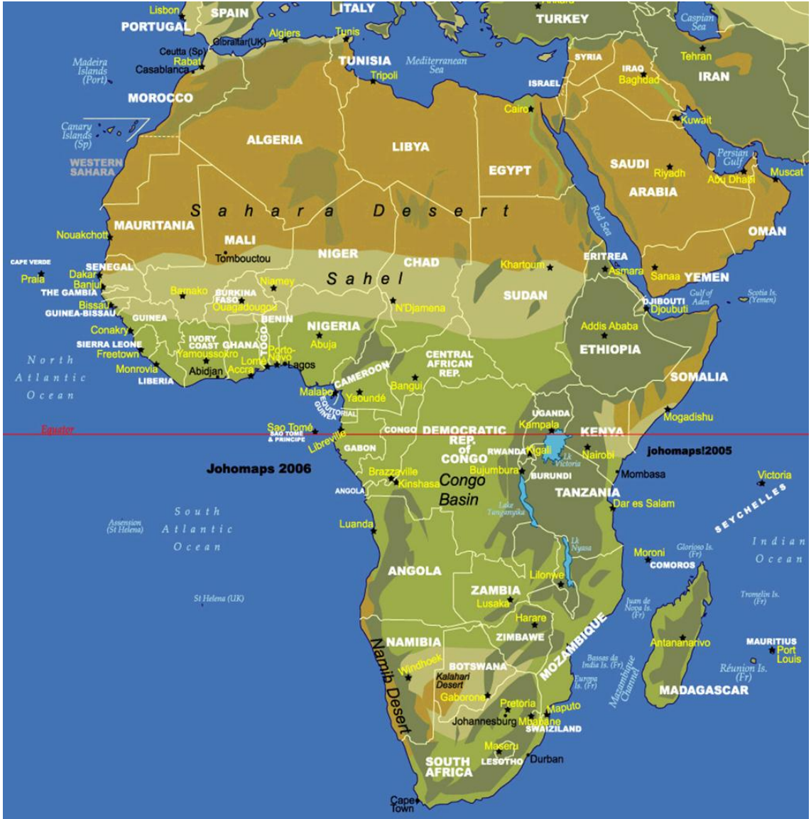
Şekil 1: Afrika Haritası