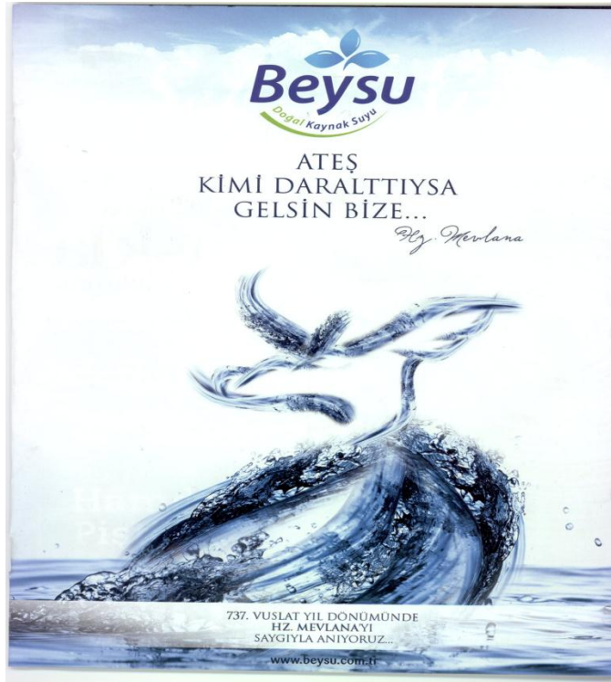
Şekil 4 Mevlânâ ve Mevlevîlik Temalı Su Reklamı