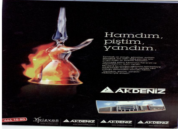
Şekil 3 Mevlânâ ve Mevlevîlik Temalı Cam Reklamı