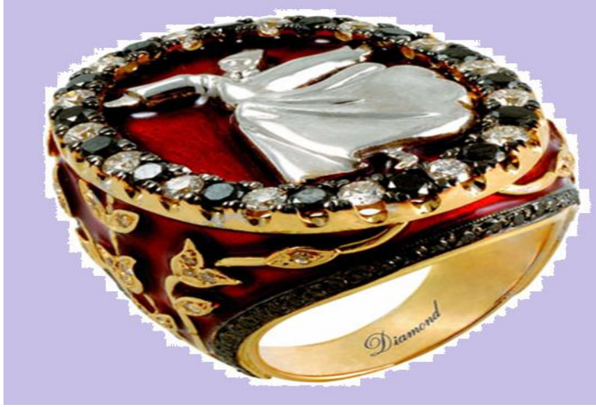
Şekil 1 Semâzen Taşlı Yüzük Reklamı