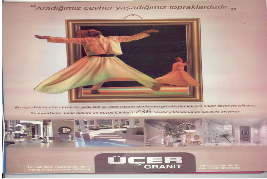
Şekil 5 Mevlânâ ve Mevlevîlik Temalı Granit Reklamı