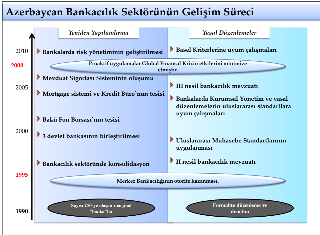
Şekil 2. Azerbaycan Bankacılık Sektörünün Gelişim Süreci

Ülkede “petrol bumu”-nun yaşanmasıyla gelişen ekonomi bankacılık sektörünün de gelişimini etkilemiş, finansal alanda olduğu gibi kurumsallaşma alanında da önemli kademeler kat edilmiştir. Merkez Bankası tarafından ekonomik konjoktürün aşırı dalgalanmalarından bankacılık sektörünün korunmasını sağlayacak alt yapı çalışmaları 2005 yılında Kredi Bürosu (Kredi Reyesteri Hizmeti) ve Mortgage sistemini (Azarbaycan İpotek Fonu), 2007 yılında ise Mevduat Sigortası sisteminin oluşturulması ile yürütülmüştür. Bankaların asgari sermaye gereksinimi kademeli olarak 2000 yılında 5 mln. ABD Doları, 2008 yılında 12 mln. ABD Doları düzeyine çekilmiştir. Gerçekleştirilmiş olan bu ve diğer çalışmalar uluslararası finansal krizin Azerbaycan bankacılık sektörüne etkilerini minimize etmeye olanak sağlamıştır.