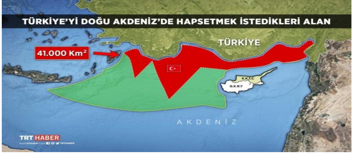
Şekil 3.2: Mısır, Yunanistan, GKRY ve İsrail'in Türkiye'yi sıkıştırmak istedikleri alan (TRT Haber 2020)