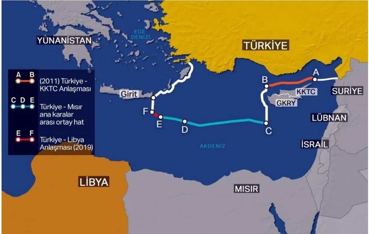
Şekil 3.3: Türkiye'nin Libya Ulusal Mutabakat Hükümeti ile Meb Antlaşması 2019 (NTV 2019)

Mursi'nin özellikle Suriye konusunda İran'da yaptığı konuşmada âdeta İran'ı sert biçimde eleştirmesi ve Özgür Suriye'den yana destek verilmesine yönelik çağrılarını sonrası Mısır-İran ilişkileri iyice gerildi. Türkiye'nin Orta Doğu politikasında Mısır'la ortak kararlarda birleşmesi İran ile