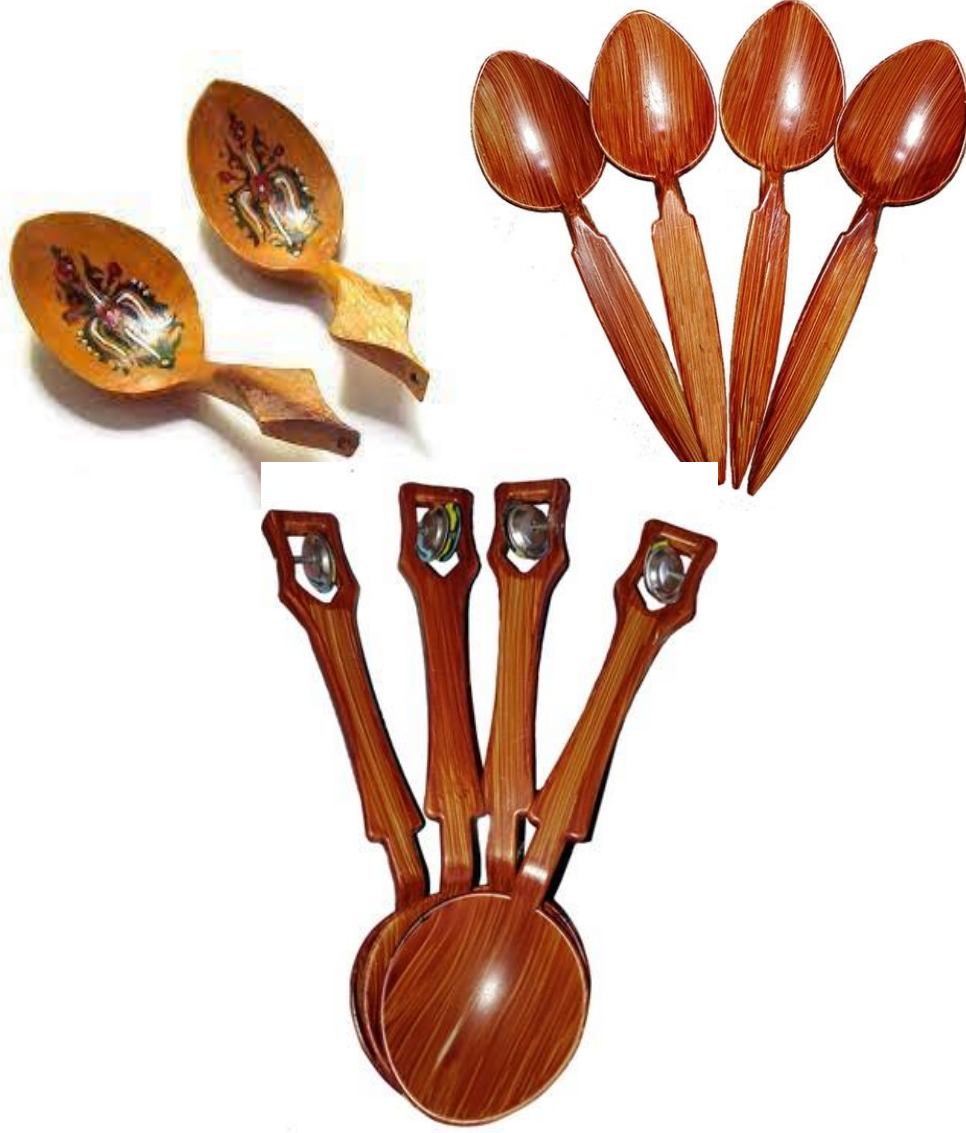
Resim 2.5. Kaşık

Bu yörelerde kaşığın özellikleri farklılık göstermekte olup örneğin; Bursa yöresinde kaşığın saplarına zincir şeklinde metal ya da tahta bir parça eklenir ve hareketlidir. Bu kaşığa tongurdaklı kaşık denilmiş ve genel olarak meşe ağacından yapıldığı bilinmektedir (Özkızıltaş, 2018, s.47).