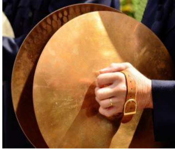
Resim 2.7. Halile (Zil)

yarayacak iplerin geçirilmesi için bir delik bulunmaktadır (Özkızıtaş, 2018, s.49). Türk müziğinde usul vurma aleti olarak geçen halilenin ortası çukurcadır ve karşılıklı vurulduğunda parlak bir ses çıkarmaktadır (Yener, 2012, s.176).