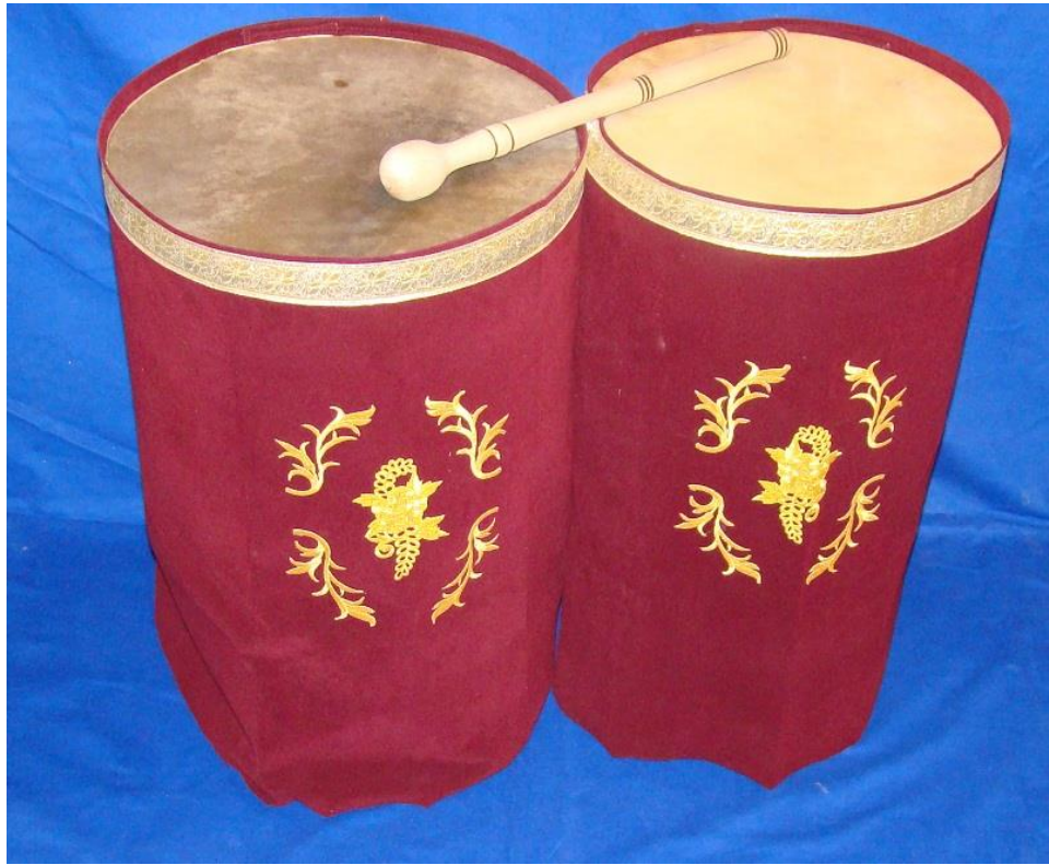
Resim 2.6. Kös

Kös çalgısı tarihten günümüze varlığını sürdürememiş yerini davula bırakmıştır. Kös günümüzde oldukça sınırlı alanlarda kullanılmakta ve mehteran takımı gösterileri haricindeki müzik eserlerinde karşımıza çıkmamaktadır. Kös mehteran takımlarının baş çalgısıdır (Erdoğan, 2015, s.179).