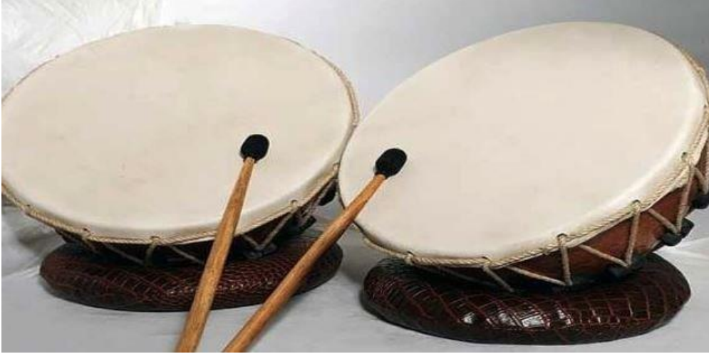
Resim 2.1. Kudüm

Kudüm kelimesinin Türkçe karşılığı olarak dömbek, dümbek, deblek, düblek ve dümbelek isimleri ile anılmakta ve çıkardığı ses ile özümşenerek düm-tek ritmi ile aynı şekilde isimlendirilmiştir (Yıldırım, 2007, s.108). Kudüm Türk müziğinin her alanında bulunmakta olup usul vurma aleti olarak Mevlevihanelerde Ladini musikisinde yer almaktadır. Mevlevi musikisinde kudüm kutsal sayılmakta olup adı “kudüm-i şerif“ olarak anılmaktadır. Bu denli önel verildiğinden dolayı Mevlevihanelerde kudüm ve kudümzenbaşı önemli bir makam olup icra edilen müziği yönetmektedir (Güneygül, 2019, s.113).