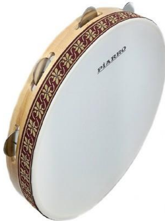
Resim 2.14. Zilli Def (Tef)

yapılmış zillerden oluşmaktadır. Zilli tef tek membranlı bir vurmali çalgı olup bir elin avuç içine yerleştirilmekte ve sesin oluşması için bazen diğer el ile vurulmakta bazen sallanmakta ve bazen de yuvarlama tekniği kullanılmaktadır. Daha iyi bir tınının oluşması için zilli defin gerilmiş derisinin kalın ve tok olması gerekmektedir. Yapısal olarak zilli def çember, deri, kasnak, 5 cm boyutunda uçları bükülü yaklaşık 20 adet olan ziller ve derinin gevşeyip gerilmesini sağlayan vida düzeneginden oluşmaktadır. Ses özelliği açısından metal komponentli tıngırtıya sahip çok iyi biçimde duyulan sese sahiptir. Membranın merkez kısmına bas (düm), çembere yakın kısımlarına ise parmakla keskin ve sert tiz (tek) tınısı ve parmak yuvarlama ya da parmak vurma ile zil tınısı çıkarılmaktadır (Dağlı, 2020, s.50).