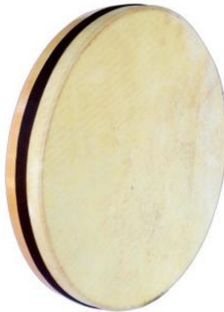
Resim 2.13. Def (Dof, Döf, Erbane)

Tarihte ilk deflerin kasnaksız olarak yapıldığı ve sonradan derinin ısıdan ve nemden etkilendiği anlaşılnca etrafına kasnak yapılmıştır. Yunanlarda tympon, Araplarda duff, İbraniler de ise toff adı verilen bu çalgı Türklerde teğre olarak da adlandırılmıştır (Yamaner, 2018, s.29). Günümüzde ise def daire, bendir, dare, tamburin veya timoani olarak anılmaktadır. Membranfondur ve perküsyon enstrümanları arasında öneli bir yeri bulunmaktadır. Def antik dönemlerden günümüze kadar kullanılan en favori müzik aletidir. Türk müziğinde, ser haneden olarak adlandırılan sadece fasıl şefinin elinde ya da birkaç hanendenin de elinde olmaktadır. Önemli bir orkestra çalgısıdır ve hayvan derisinde imal edildiğinden dolayı ortamın ısısına göre gerginleşip gevşeyebilmektedir. Çalmaya hazırlamak için enstrüman ısının üstünde her noktasına ısıyı eşit dağıtmak için dairesel el hareketleri ile def ısıtılmaktadır. Derinin sertleşmesi sonucunda deften daha net bir ses çıkmaktadır. defin orkestra davulunun sesinde uzak olamayan bir ses çıkardığı bilinmektedir (Civelek, 2021, s.56).