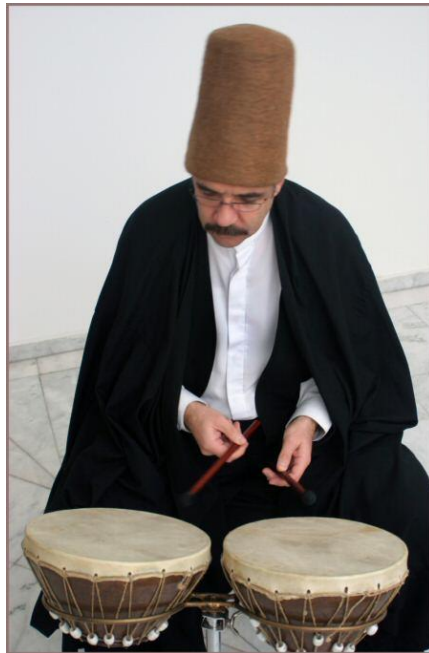
Resim 2.2. Kudüm Çalan Mevlevi

Kudüm kelimesinin Türkçe karşılığı olarak dömbek, dümbek, deblek, düblek ve dümbelek isimleri ile anılmakta ve çıkardığı ses ile özümşenerek düm-tek ritmi ile aynı şekilde isimlendirilmiştir (Yıldırım, 2007, s.108). Kudüm Türk müziğinin her alanında bulunmakta olup usul vurma aleti olarak Mevlevihanelerde Ladini musikisinde yer almaktadır. Mevlevi musikisinde kudüm kutsal sayılmakta olup adı “kudüm-i şerif“ olarak anılmaktadır. Bu denli önel verildiğinden dolayı Mevlevihanelerde kudüm ve kudümzenbaşı önemli bir makam olup icra edilen müziği yönetmektedir (Güneygül, 2019, s.113).