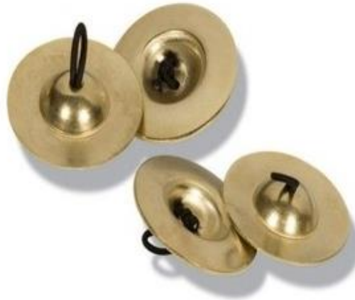
Resim 2.4. Parmak Zili

Parmak zili birkaç yüzyıl öncesine kadar çenk olarak isimlendirilmiş oluş cariyelerin parmaklarına takarak dans ettikleri bir zil olarak bilinmektedir (Yener, 2012, s.172). Eski zamanlardan itibaren bilinen kadınların parmaklarını takarak meşk ettikleri parmak zili pirinçten yapılan aletlerdir. Bakır alaşımdan ve bronzdan yapılmasının yanında genel olarak pirinçten yapıldığı bilinmektedir. Parmak zillerinin şekli yuvarlak olup ortalarında bir delik bulunmaktadır. Parmak zillerinin ortalama boyutu 5-6 cm civarındadır. Bu deliklerden lastikler geçilmekte ve parmaklara bu lastikler aracılığı ile takılması sağlanmaktadır. Her iki elde de birbirine vurularak ses çıkaran ikişer zil bulunmakta olup toplamda dört zilden oluşmaktadır. Ziller baş ve orta parmağa takılmakta olup günümüz orkestra, oyun havaları ve hareketli ezgilerin icrasında yaygın olarak kullanılmaktadır (Özkızıtaş, 2018, s.49).