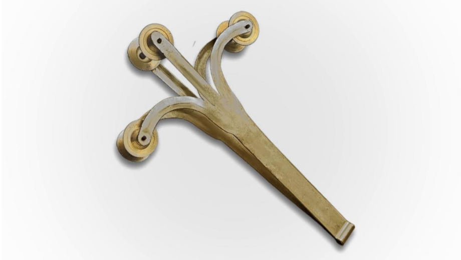
Resim 2.10. Zilli Maşa