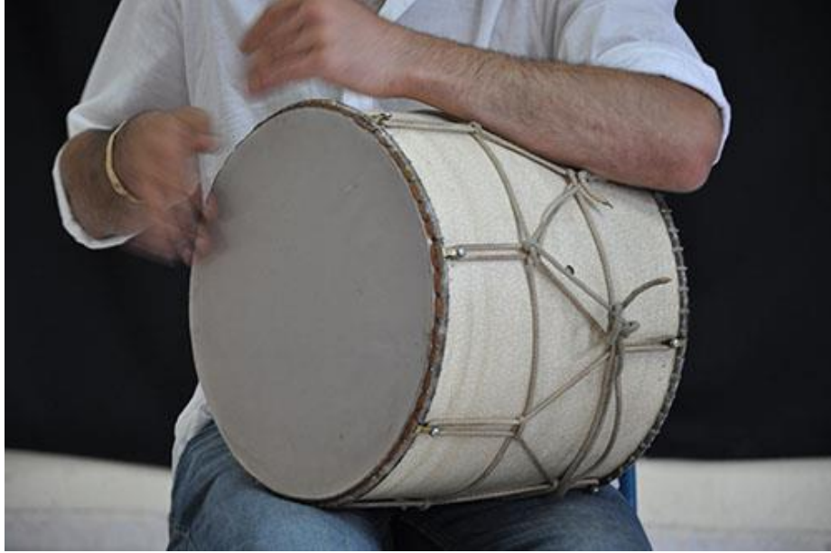
Resim 2.11. Koltuk Davulu (Nağara)

tarafa konulduysa sol el güçlüdür ve ana vuruşları gerçekleştirmekte, sağ el ise ara vuruşlar ie hafif vuruşlar yapmaktadır. Genel olarak koltuk davulunun icrasında sol taraf tercih edilerek sağ el ile ana vuruşlar yapılmaktadır (Uzunbaş, 2012, s.27).