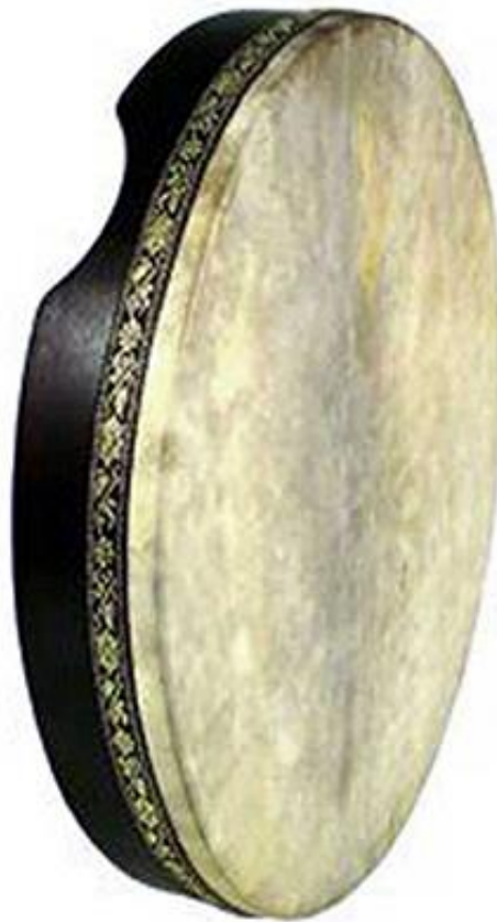
Resim 2.8. Bendir

olmak üzere iki malzemedden oluşmaktadır. Günümüzde ise bendir çeşitlenmiş ülke ve kültüre göre farklı yapılara sahip bendirler bulunmaktadır. Bazı bendir çeşitlerinde çembere ip takılmakta ya da ahşap olan çember metal olarak yapılmaktadır. Bu tip bendirler de deri germe yöntemi de farklılık göstermektedir. Bu tip bendirler de dış metal çemberde vidalı çubuklar bulunmakta ve deri germek için bu vidalar kullanılmaktadır. diğer deri germe yöntemleri ise kasnak çembere yapıştırılarak deri gerdirilmekte ve iplerle deri gerdirme yöntemleri kullanılmaktadır (Akdemir, 2017, s.996).