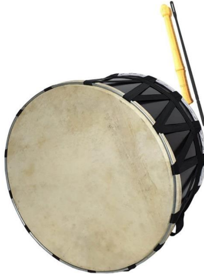
Resim 2.3. Davul

Davulun bölümlerine bakıldığında deri çemberi, kasnak, tokmak, davul kayışı, davul derisi ve cıbıktan oluştuğu görülmektedir. Davul kasnağının en iyisinin ceviz ağacından yapıldığı bilinmekte olup çam, gürgen, kayın gibi ağaçları da yapımında kullanılmaktadır. Davulun derisi ise dana ya da keçi derisinden yapılmakta olup meydan saızı olarak geçen davul zurna ile bütünleştirilmiştir ve Türkiye'nin her bölgesinde kültüründe davul bulunmaktadır (KTB, 2022).