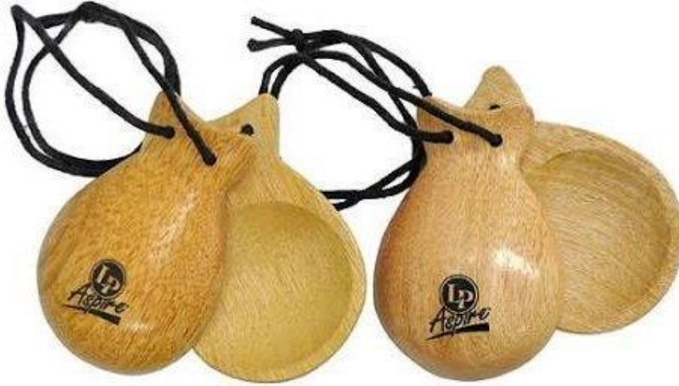
Resim 2.9. Çalpara

metalden oluşmaktadır. Çalpara da yuvarlak ahşaplar birbirine vurularak ses çıkarılmaktadır. Kase şeklinde olan çalparanın ortalarına bir deli bulunmakta, bu deliğe ip geçirilerek tutması kolaylaştırılmaktadır. Aynı zamanda tutamak bulunan kulplu ve konik şeklinde olan çalparalarda bulunmaktadır. Çalpara tınlayarak ses oluşturmakta ve sesin rengi çalparanın büyüklüğüne ve küçüklüğüne göre farklılık göstermektedir. Çalpara aynı zamansa sýmbal ve zil olarak da geçmektedir (Yamaner, 2018, s.31).