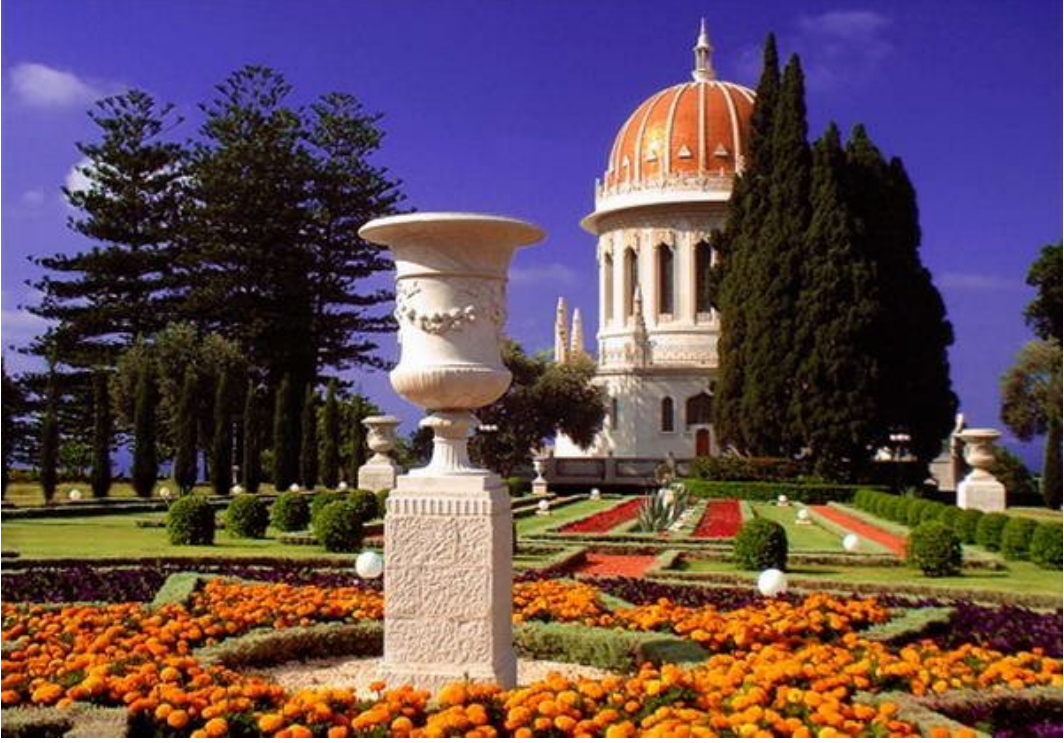
Adalet Evi, Hayfa/İsrail