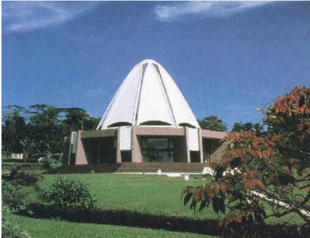
Bati Samoa Mabeti, Apio / Bati Samoa