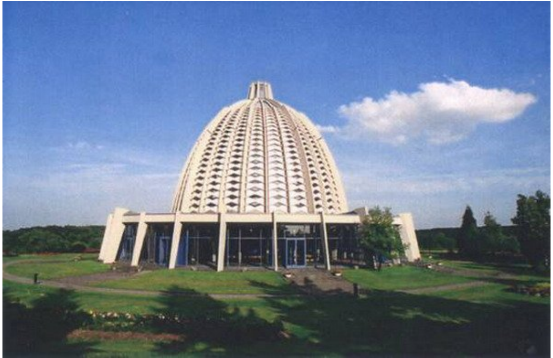
Almanya Mabedi, Langenheim / Almanya