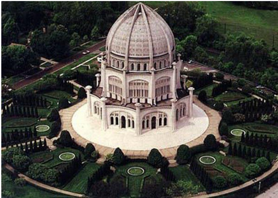
Amerika Mabedi, Wilmette