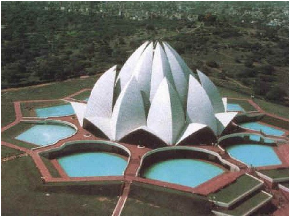
Hindistan Mabedi, Bahapur/Yeni Delhi