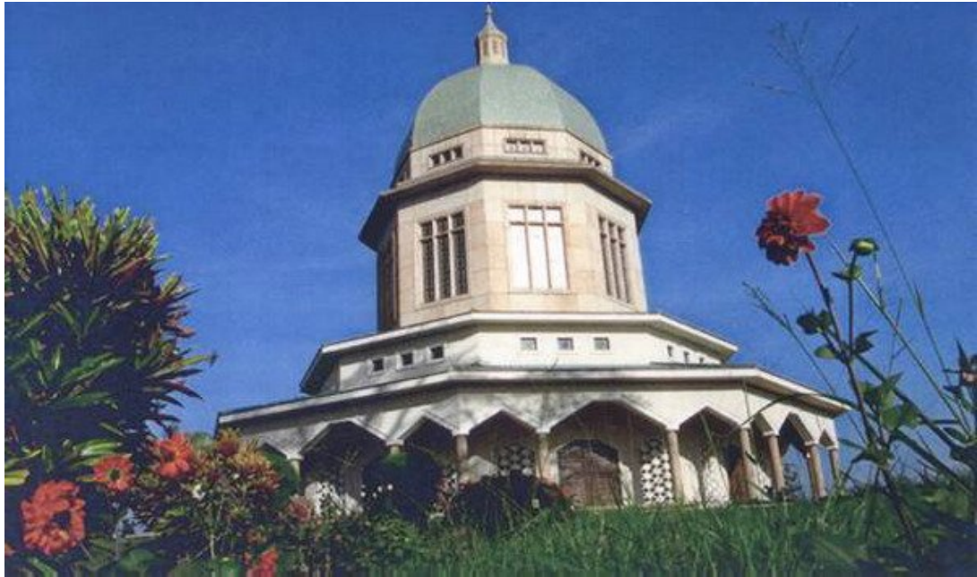
Kampala Mabedi, Kikaya Hill