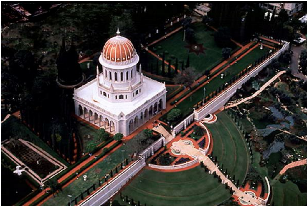
Adalet Evi, Hayfa/İsrail