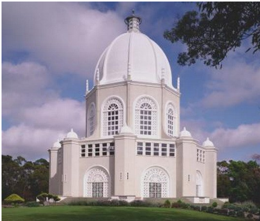
Avustralya Mabedi, Mona Vale / Avustralya