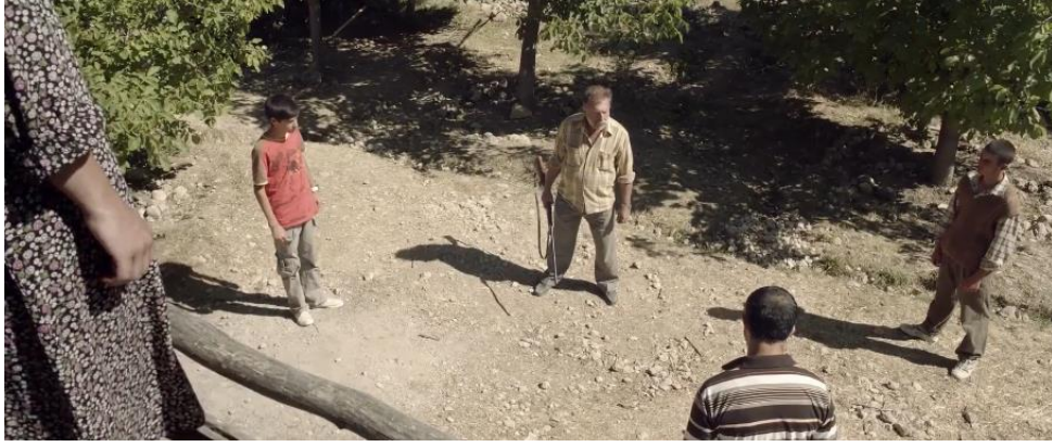
Görsel 10 Grubun erkekleri Yörüklerden intikam almak üzere plan yapıyor.

Çoğunluk 'ta tanık olunan, topluluğun hegemonik liderinden yayılan baskıcı ilişki biçimi ve bunun yarattığı genel mutsuzluk, olumsuzluk durumunu Tepenin Ardı 'nda da görmek mümkündür. Faik'in insanlarla kurduğu tahakküme dayalı ilişki biçiminin, gruptaki üyelere hatta yaşadıkları araziye dahi sirayet eden depresif bir ruh hali oluşturduğu görülür. Filmdeki bazı sahnelerin birlikte düşünülmesi, bu durumu örnekleyecektir. Faik'in Mehmet'e borcunu sormasından ve ödeyememesi durumunda keçilerini alacağını söylemesinden sonra Mehmet'in buna karşılık veremediğini, öfkesini ise Faik'in arazisindeki fidanlara gizlice zarar vererek ifade ettiğini görürüz. Faik fidanlarına gelen zararı, beklendiği üzere, Yörüklere yormaktadır. Dolayısıyla Faik'in hegemonyacı ilişki biçimi bir yandan ona fiziksel zarar olarak dönerken diğer yandan da içindeki düşmancıl duyguların derinleşmesi olarak dönmektedir. Dolayısıyla Faik'in kurduğu bu ilişki biçimi, tahakküm kurduğu kişilerin yanı sıra kendisine de maddi ve manevi zarar vermektedir.