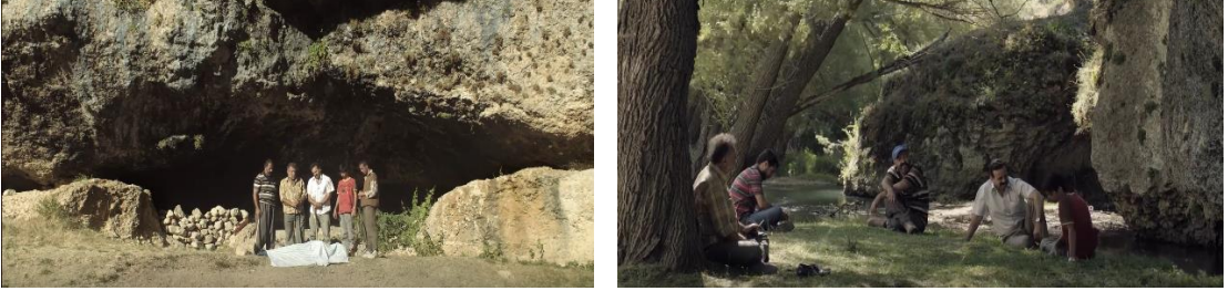
Görsel 8 Tepenin Ardı’nda sıkça görülen homososyal erkek grupları.

yaşam biçimlerinin yok olmasıyla açıklamıştır. Günümüz Türkiye’inde kırsalda yaşayan, iletişim ve ulaşım olanaklarından ötürü küreselleşmeden nispeten az etkilenen bazı coğrafyalarda ise pederşahilik hala önemli ölçüde etkilidir (Arslan, 2019). Kırsalda yaşan Faik karakterinin ön planda olması ve olayların da bu kırsalda geçmesi açısından, filmde bu geleneksel sistemin izlerini görmek mümkündür.