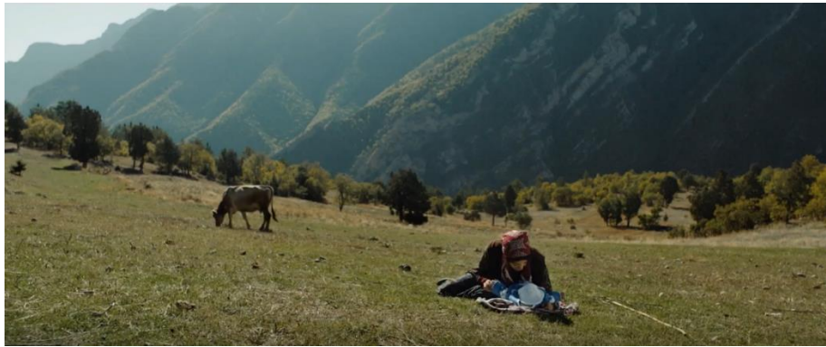
Görsel 16 Reyhan, rahatlatıcı bir manzara eşliğinde çocuğu Gökhan'ı seviyor.