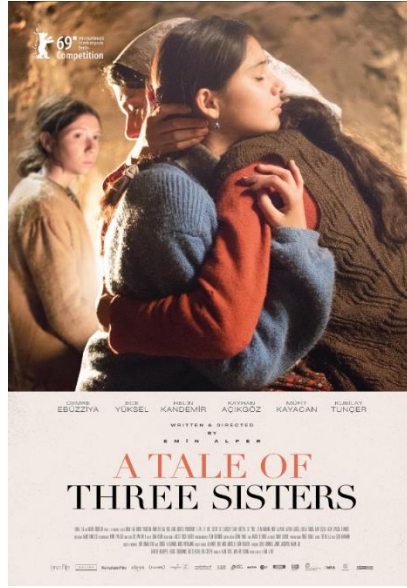
Görsel 11 Kız Kardeşler filminin afişi.