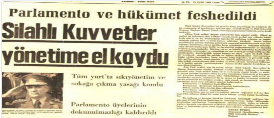
Şekil 3: Cumhuriyet Gazetesinde Yer Alan 12 Eylül 1980 Tarihli Haber

12 Eylül 1980 askeri darbesi dönemine bakıldığında ise ilk dönemde gazetenin tarafsız ifadelerle darbeyi duyurduğu görülmektedir.