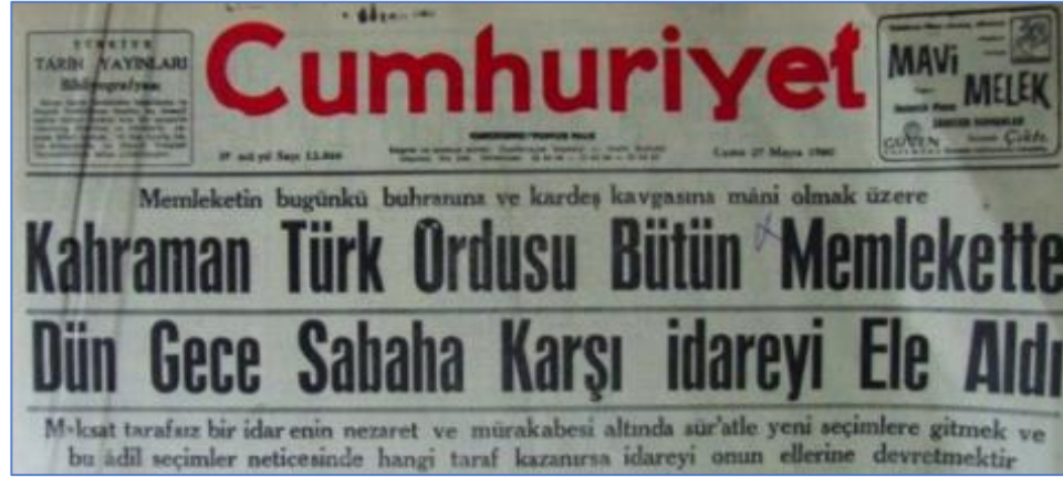
Şekil 2: Cumhuriyet Gazetesinde Yer Alan 27 Mayıs 1960 Tarihli Haber