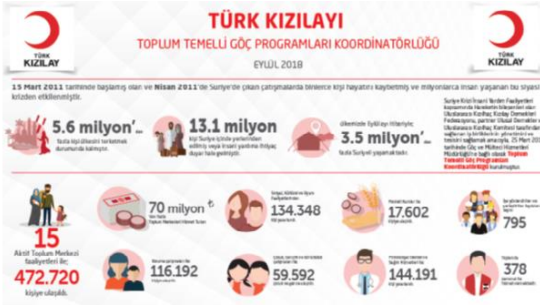
Şekil 3. Türk Kızılay Toplum Merkezi bulunan illerde yerel ve ulusal işbirlikleri program kapsamında yürütülmekte, eğitimler ve çalıştaylar düzenlenmektedir.

Türk Kızılay'ın çalışma alanları bağlamında;