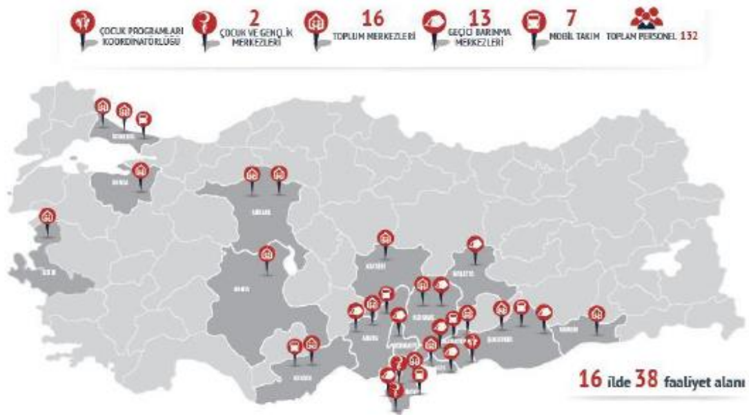
Şekil 4. Türk Kızılay Toplum Merkezi bulunan illerin dağılımı. (Diğer programlar kapsamında faaliyetlerin yürütüldüğü merkezler dâhil)

aynı zamanda okul, ev ve dış çevre dengesi bakımından da geçici koruma kapsamındaki Suriyeliler açısından can simidi rolü oynamış durumdadır. 20 Ocak 2015 tarihinde Türk Kızılay ilk Toplum Merkezini yereldeki işbirlikleriyle Şanlıurfa’da kurmuştur. Giderek yerel ihtiyaçlara göre sayıları artan Toplum Merkezleri’nin Şanlıurfa, İstanbul (Anadolu ve Avrupa yakası), Konya, Ankara, Kilis, Bursa, İzmir, Adana, Mersin, Gaziantep, Hatay, Kayseri, Kahramanmaraş ve Mardin illerinde olmak üzere toplam sayıları 16 olmuştur. Toplum merkezleri hem yerel nüfusa hem de her türden sığınmacı nüfusa hizmet sağlamaktadır. STM de 31 Ağustos 2015 tarihinde hizmete girmiştir. (Şekil 4.)