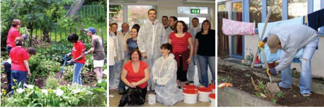
Şekil 4: Paddington Bölgesi Gönüllü Çalışmaları

destek vermesi için çalışmaktadır. Bu tip projelerin başında eğitim projeleri gelmektedir. Sağlanan maddi yardımlar, okul arazilerinin iyileştirilmesi ve ek projelerin (dil, konuşma, tedavi gibi) geliştirilmesi gibi faaliyetlerde kullanılmaktadır. Bunun yanı sıra ortaklıkta yer alan yerel firmalar, okulların talep ettiği bazı projeleri doğrudan kendileri uygulamakta ya da iş gücü ve kaynak sağlayarak katkıda bulunmaktadır.