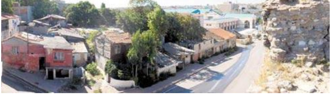
Şekil 18: Sulukule Genel Görünüm

Uluslararası Çıgan Festivali'ni düzenlemişlerdir. Sonrasında tekrar bir araya gelme ve yeni bir Roman Mahallesi kurma girişimleri başarısızlıkla sonuçlanınca dernek feshedilmiştir.