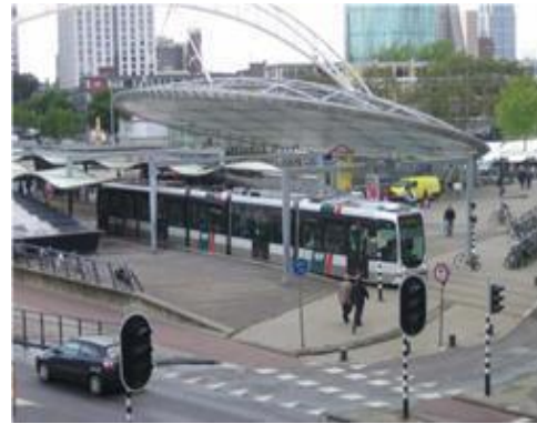
Şekil 7: Erasmus Köprüsü ve Metro İstasyonu

➤ Kentin imajını değiştirmek: İş yerleri, konut alanları, eğitim ve rekreasyon alanlarının bulunduğu yaşanabilir bir bölge yaratmak, kamu mekânları da dahil olmak üzere mimarisi kalitesi yüksek binalar tasarlamak, eski binaları yeniden kullanıma sokmak