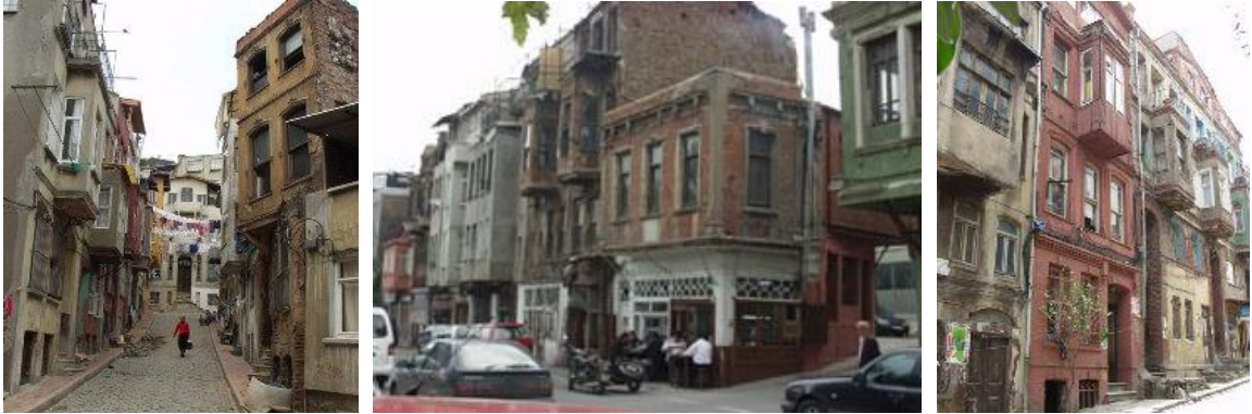
Şekil 14: Fener-Balat Restorasyon Öncesi Sokaklar

Fener ve Balat semtleri, Tarihi Yarımada'da, batıda tarihi kara surları, güneyde Haliç arasında kalmış bir bölgedir. Rum, Musevi ve Ermenilerin toplumsal ve kültürel yaşantılarının odak noktası olan bu bölgelerin köhneleşmesi, 1950'li yıllardan sonra Anadolu'dan gelen göçmenlerin, gayrimüslim azınlıkların yerini almalarıyla başlamıştır. Bölgede zaten kötü olan sosyal ve ekonomik koşullar, 1980'li yıllarda Haliç'in de sanayisizleştirme sürecinin kurbanı olmasıyla daha da kötüye gitmiş ve bu semtlerde ticari canlılık yok olmaya başlamıştır (İslam, 2006, s.55). 1990'ların sonlarında, harap yapıların bulunduğu Fener ve Balat, tümüyle bir yıkıntıya dönüşme tehlikesiyle karşı karşıya kalmıştır. Ayrıca bazı yapılar tamamen çökmüştür, ayakta kalabilenlerin %20'si ise gayet kötü durumda kalmıştır. Fiziksel problemlerin yanı sıra, bölgede çözülmesi gereken sosyal problemlerde artmıştır (www.fenerbalat.org, 2009).