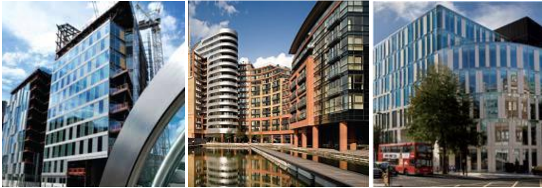
Şekil 3: Paddington Bölgesi Ofis ve Konut Binaları

➤ Yerel ekonomik gelişmeyi sağlamak: Ortaklık Paddington'daki yerel ekonominin güçlendirmek ve canlı kalması için çalışmalar yapmaktadır. Yaratılan yeni iş olanaklarına erişimde yerel halka öncelik tanınmasına karar verilmiş, bu sebeple yerel halka iş fırsatlarına erişimde yardım edecek birim olan Paddington First kurulmuştur. Paddington First, iş ilanları ile iş başvurularını eşlemekle beraber farklı sektörlerdeki eleman ihtiyacına göre çeşitli programlar geliştirmektedir. Bu kapsamda işverenlerin talep ettiği yeteneklere göre eğitim kursları, öğrenciler için kariyer programları sağlanmaktadır.