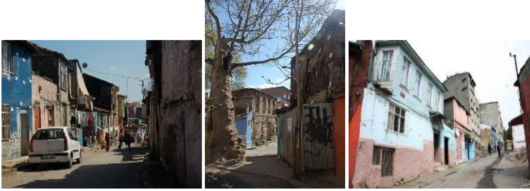
Şekil 19: Yıkımdan önce Sulukule Sokakları

Kanun kapsamında Kentsel Yenileme bölgesi olarak ilan edilmiştir. 03 Nisan 2006 tarih ve 2006/10299 karar sayısı ile “Fatih Hatice Sultan – Neslişah Mahalleleri Yenileme Alanı” olarak Bakanlar Kurulu tarafından kabul edilmiştir.