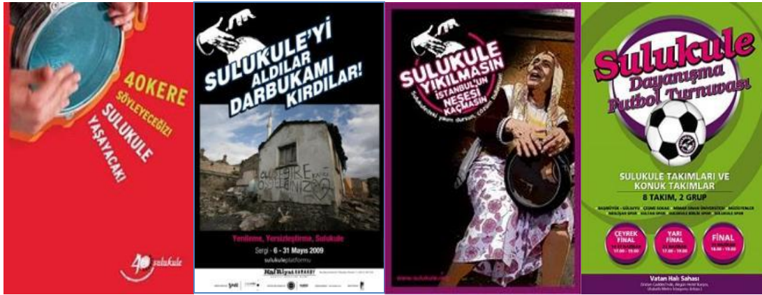
Şekil 22: Çeşitli Etkinlik Posterleri

Sulukule Platformu ve platform altında faaliyet eden birçok kurum, projenin yerel halkın bilgisi olmadan tasarlandığını ve projenin rant amaçlı bir proje olduğunu düşünmektedir. Sulukule Platformu'nun bazı üyeleri Roman Açılımı çalışmaları çerçevesinde yapılan toplantılara katılmaktadırlar. Platform, halen daha çalışmalarını mahallede sürdürmektedir.