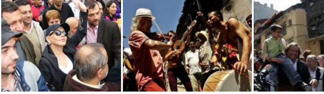
Şekil 23: Sezen Aksu ve Gogol Bordello ve Tony Gatlif Ziyaretleri