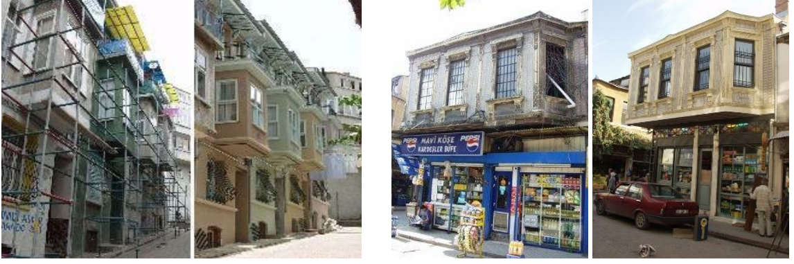
Şekil 15: Fener-Balat Restorasyon Öncesi ve Sonrası Bazı Binalar

✓ Balat Çarşısı: Çarşının alt yapı ihtiyaçları dikkate alınarak çarşıdaki dükkânların restorasyonun yapılması