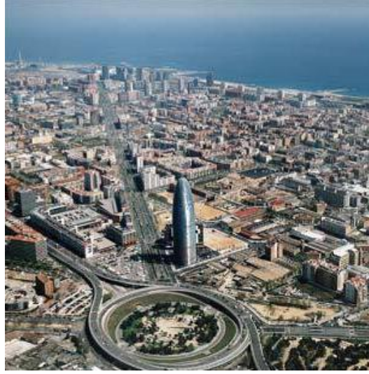
Şekil 10: Poble Nou Genel Görünüm

Barselona, nüfusuyla yoğunluğu en yüksek Avrupa kentlerinden biri olma konumundadır. Nüfusu 4,3 milyon olan ve yaklaşık 2 milyon kişiye iş imkânı sağlayan Barselona, İspanya ekonomisinde ki payı oldukça büyük olan bir kenttir.