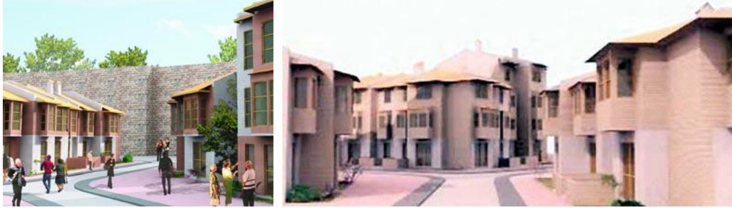
Şekil 20: Proje Görselleri