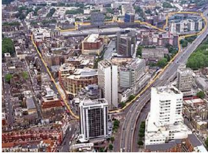
Şekil 1: Paddington Bölgesi Genel Görünüm

Proje; 1998 yılında mülk sahipleri, yatırımcılar ve bölge içerisinde yer alan sağlık-ulaşım firmalarının katılımıyla oluşturulan “Paddington Waterside Ortaklığı” çerçevesinde geliştirilmiştir. Ortaklık, proje uygulamalarının bölgeye sosyal, fiziksel ve ekonomik olarak uygunluğunu sağlamak için yerel yönetim, okullar, gönüllü kuruluşlar gibi yerel organizasyonlar ve özel sektörle birlikte çalışmaktadır. Bu çalışma, ortaklığın kurduğu dört farklı birim (Paddington Businesses Improvement District (BID), Paddington First, Time for Paddington, Inpaddington) tarafından gerçekleştirilmektedir. Ortaklığın eylemleri dört ana başlık altında toplanmaktadır;