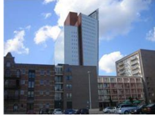
Şekil 8: Kop van Zuid Ofis ve Konut Binaları

✓ Rotterdam'ın pozisyonunu yeniden değiştirmek: Kenti yatırımcılar ve modern endüstri için çekici hale getirerek Rotterdam'ın ekonomisini değiştirmek, insanlar için yaşamak isteyecekleri ve iş bulabilecekleri bir mekân sağlamak