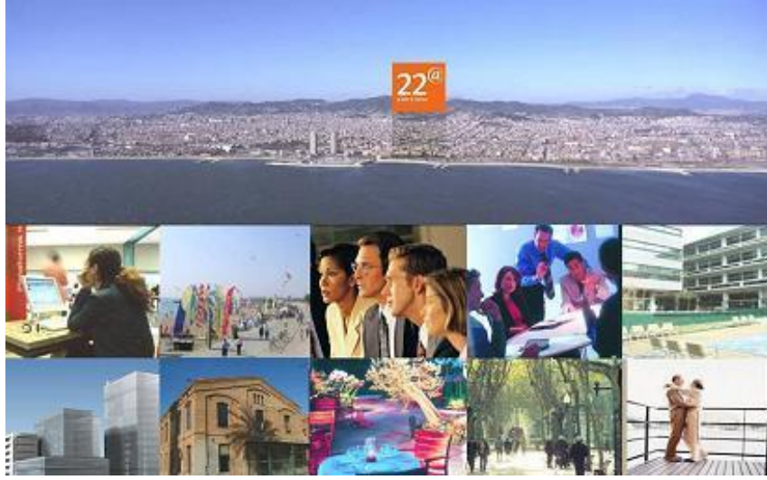
Şekil 11: 22@ Barselona Projesi Broşürü Sunum Kapağı

aktivitelere ev sahipliği yapmakta, bağımsız sanat akımlarının gelişebilmesi için ortak kullanım mekânları tasarlanmaktadır. ( www.22barcelona.com , 2009)