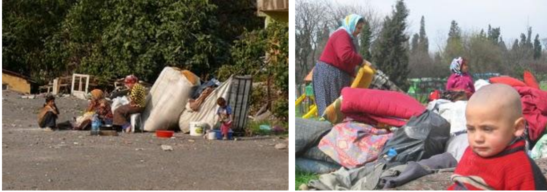
Şekil 25: Yıkım Sonrası Görüntüler

“Ben evde değildim, bir iş için Bursa’ya gitmişim. Meğersem bir kâğıt gelmiş. Fakat bizimkiler resmi bir evraka benzeyen o kâğıdın ne olduğunu anlamamışlar. Ertesi gün yıkım ekipleri evi yıkmış, bizimkiler eşyaları kurtaramamış” (erkek)