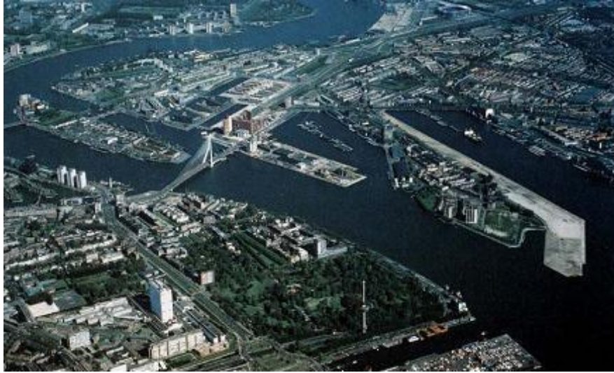
Şekil 6: Kop van Zuid Genel Görünüm

Kop van Zuid'de bulunan liman bölgesinin, 1960 ve 1970 yıllarında bölge dışına ve daha batıya kaydırılması ile Kop van Zuid fonksiyonunu yitirmiş ve bölge adeta terk edilmiştir. Bölge işsizlik oranının yüksek olduğu, imajı zayıf, insanlar için yaşama isteği uyandırmayan ve yatırımcıların ilgisini çekmeyen bir hal almıştır. Bu alan için yapılması tasarlanan sosyal konutların planları, 1979 yılında yapılmış ve 1980'lere kadar bu konutlar uygulanmıştır. 1980'de konutların yapımı tamamlandıktan sonra, devlet kentsel yenileme konusunda politikasını değiştirmiştir. Artık, ekonominin gelişmesi, ticari piyasa rekabetinin artması ile birlikte ülkeler arasındaki çekişmeler artış göstermiştir. Rotterdam'ı kalkındırma çalışması kapsamında Kop van Zuid için 1986 yılında dönüşüm planı tasarlanmıştır.