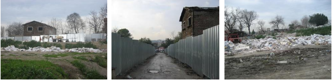
Şekil 26: Sulukule'nin Son Hali

“Sabancı Üniversitesi’nden bir öğrenci araştırma yapmış. Belli bir zaman aralığında Başbakan 300 kelime, Fatih Belediye Başkanı 400 kelime, ben altı kelime etmişim. Ama gene de medyaya bir şey demek istemiyorum. Hemen hemen hepsi geldi.” (Pündük)