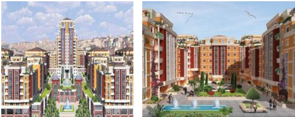
Şekil 16: Sümer Mahallesi Proje Görselleri