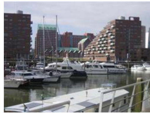
Şekil 9: Kop van Zuid Alışveriş Alanı ve Rıhtım

Erasmus köprüsü ve metro istasyonu, projenin ilk etabında gerçekleştirilmiştir. Böylelikle kamusal ulaşım ağları geliştirilmiş ve eski demiryolu depoları üzerinden geçen