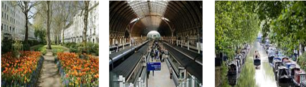
Şekil 5: Paddington Bölgesi Ortak Kullanım Alanları

➤ Kamu mekânları sağlamak: Proje kapsamında, ofis, konut, alış-veriş, sağlık ve boş zaman faaliyetlerini içerecek şekilde yaklaşık 8 milyon m 2 lik bir alanının yeniden yapılandırılması hedeflenmiştir. Projede, ilginin sürdürülebilmesi ve bölgenin imajını düzeltmek için yüksek kaliteli kamusal alanlar oluşturmayı amaçlamıştır. Kamu mekânlarının oluşturulmasında ortaklığın üzerinde durduğu konu, yeni gelişmelerin mevcut doku ile uyum ve bütünlük içinde olmasıdır ( www.paddingtonwaterside.co.uk , 2009).