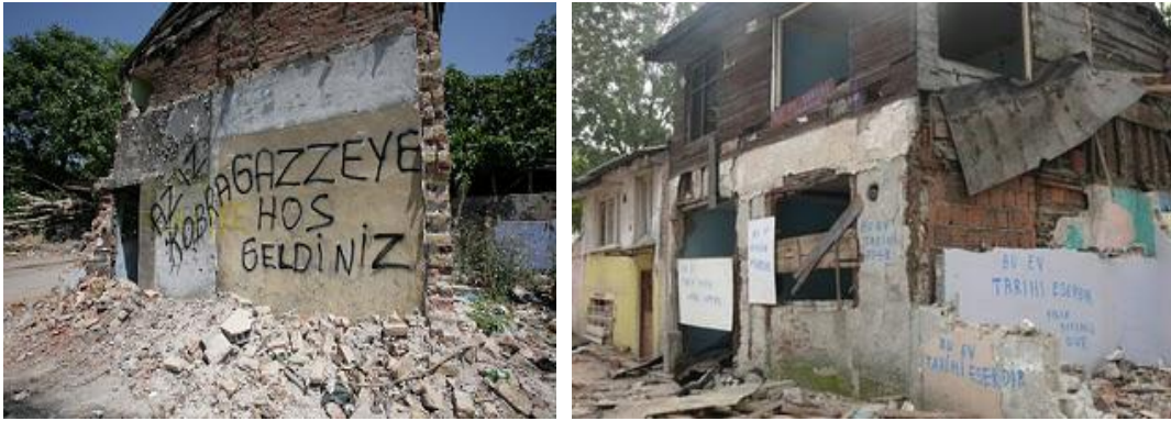
Şekil 21: Yıkım Görüntüleri

Yıkımlara karşı yapılan kampanyalara rağmen Şubat 2007'de başlayan yıkımlar, aralıklarla devam etmiştir. Yıkımlar sırasında Belediye tarafından yanlışlıkla olduğu söylenen bazı tescilli tarihi binaların yıkıldığı gözlenmiştir. Yıkımlar, Aralık 2009'da tamamlanmış ve inşaat aşamasına geçilmiştir.