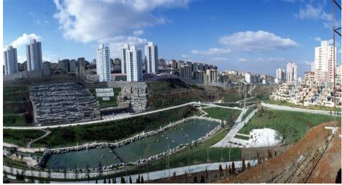
Şekil 13: Dikmen Vadisi Üçüncü Etap'tan Görüntüler

Ankara Büyükşehir Belediyesi Meclisi'nde 17 Şubat 2006 tarihinde "Dikmen Vadisi 4. ve 5. Etap Kentsel Dönüşüm Projesi" karara bağlanmış, bölgede 2.786 hak sahibi olmak üzere 8.000'den fazla konutun yapımı planlanmıştır. Bölge halkı, kendilerine sorulmadan tasarlanan projelerin belirli bir azınlığa, özellikle de projeyi yapıp yürüten kamu ve/veya özel idarecilere ve çevrelerine rant sağlamak amacıyla yapıldığı gerekçesiyle