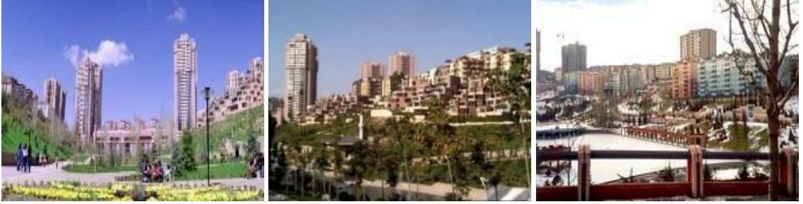
Şekil 12: Dikmen Vadisi’nden Görüntüler

Projenin birinci etabında hak sahiplerine verilmek üzere tasarlanan konutlar, 80 m2 büyüklüğünde ve görece düşük kalitede inşa edilmiştir. Toplam 180 bin m2’den oluşan bu etap 2000 yılında tamamlanmış ve yapılan 404 adet konutun 330’u hak sahiplerine kura ile teslim edilmiştir. Ayrıca, hak sahipleri için yapılan konutların yanı sıra vadede projenin finansmanında kullanılmak üzere lüks konut ve işyeri kullanım alanları da yapılmıştır. “Kültür Köprüsü” adı verilen 26 katlı lüks yapıda 219 konut ve 60 ticari birim bulunmaktadır (Sönmez N.Ö., 2006, s. 124).