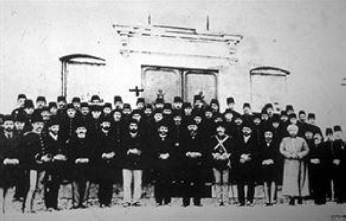
Kaynak: Mithat Cemal Kuntay, Mehmed Akif (Hayatı-Seciyesi-Sanatı- Eserleri) , İstanbul 1939.