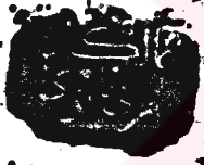
«Fadâilü's-Süver» adlı kitabın birinci sayfası (Köprülü Kütüphanesi, no. 1163)

قال الشيخ الامام ابو الحسن علي بن ابي طالب المتنابوزي قدس الله روحه احب اليه من محمد بن ابيهم المهداني له عتقته الزاهدان والشيخ محمد بن العزق رحمته على كل ذي قلب فقيه على خلق عام على من جعله املى لزي المشي في ربه هي فريقتك اني فاقان ما يفتك اذا دعوتك فقلتك اني فاقان استجبوا لله والى اولادنا ان اعلموا اعظم شوق من العار من المسند قال رحمه الله رب العالمين ربنا المولى على بعضه عن عبيده ففان احسن القوم احسنهم ففان اه اجبت على اليرورين عندنا ففان ففان ففان الرحمن الرحيم