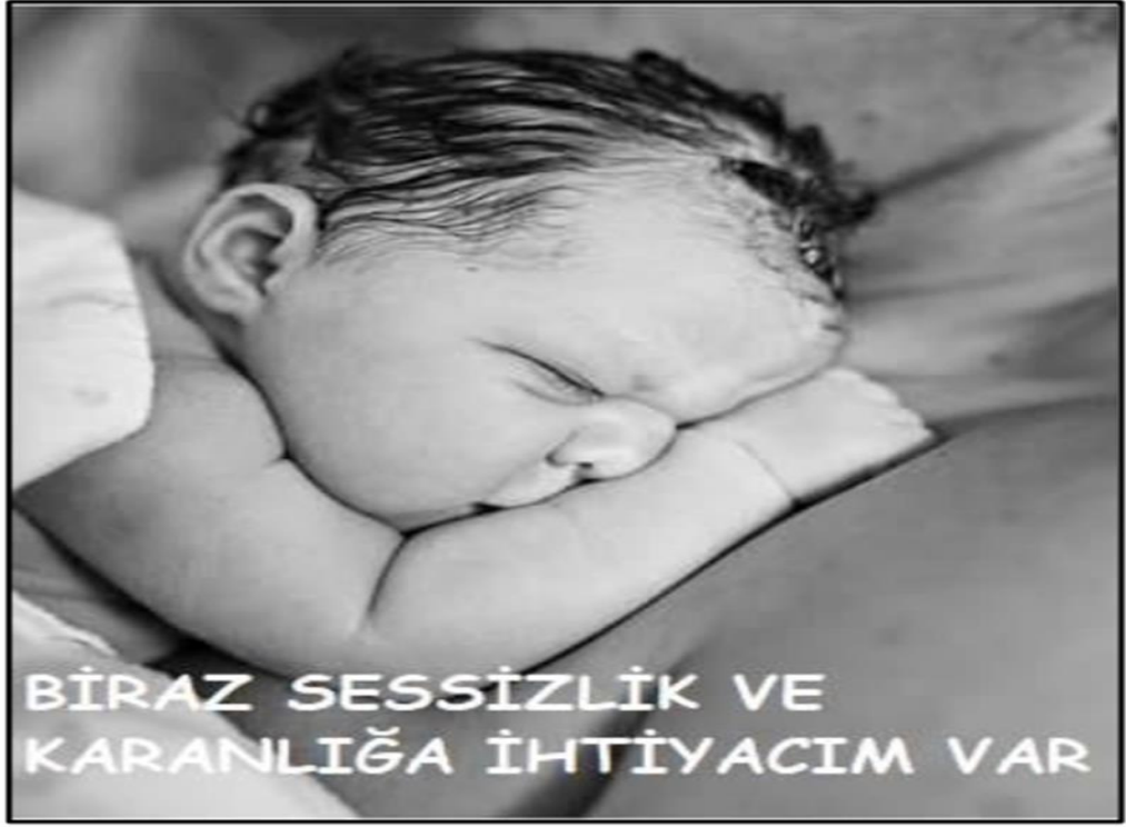
Işık ve Gürültü Yönetimi İçin Uyarıcı Fotoğraflar – 5