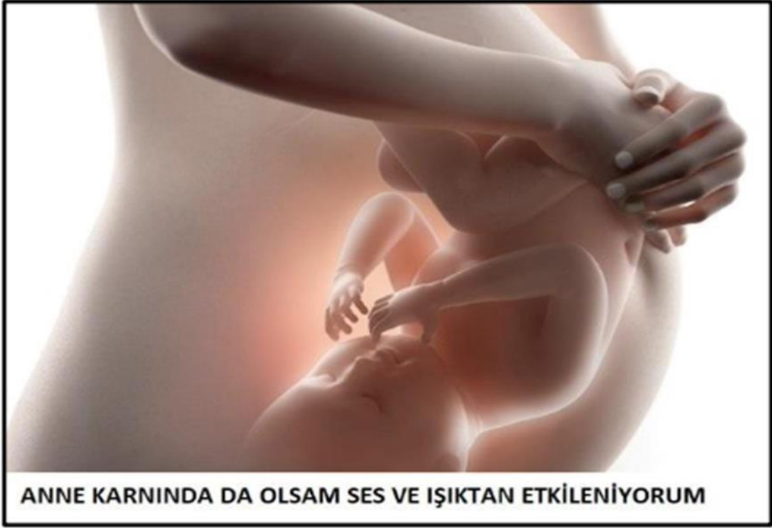
Işık ve Gürültü Yönetimi İçin Uyarıcı Fotoğraflar – 1