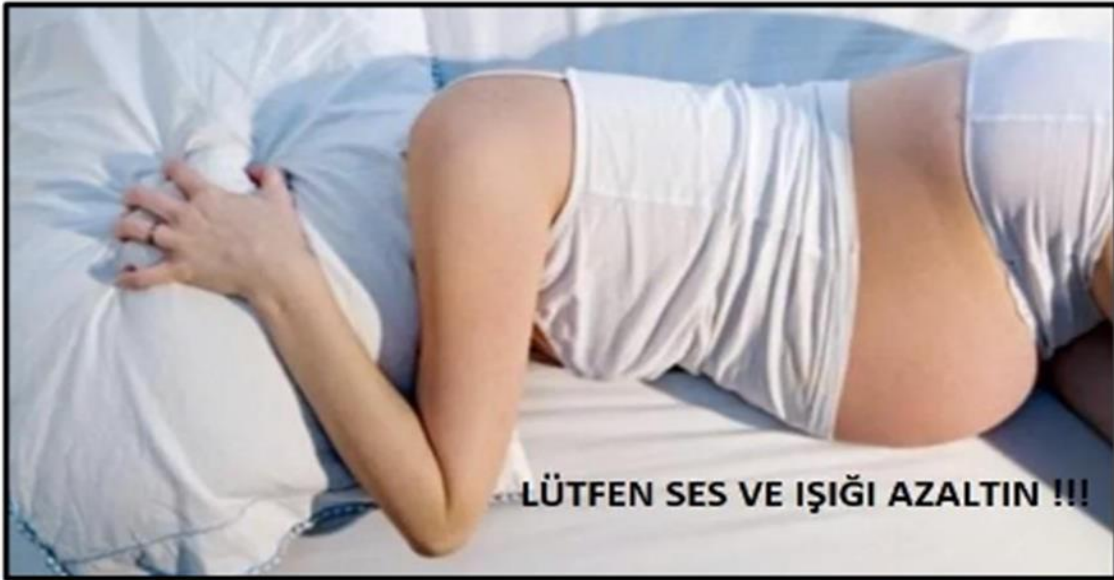
Işık ve Gürültü Yönetimi İçin Uyarıcı Fotoğraflar - 2