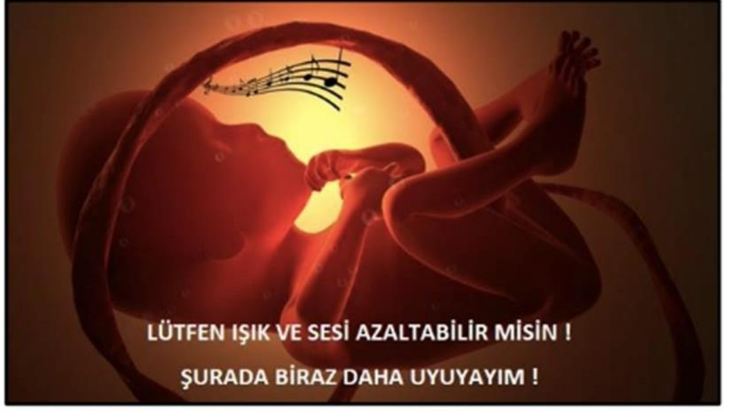
Işık ve Gürültü Yönetimi İçin Uyarıcı Fotoğraflar –6