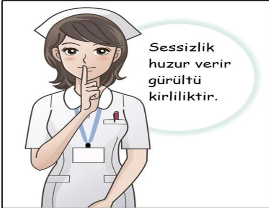
Işık ve Gürültü Yönetimi İçin Uyarıcı Fotoğraflar – 8