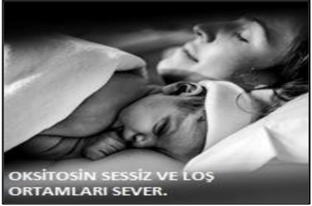
Işık ve Gürültü Yönetimi İçin Uyarıcı Fotoğraflar – 4