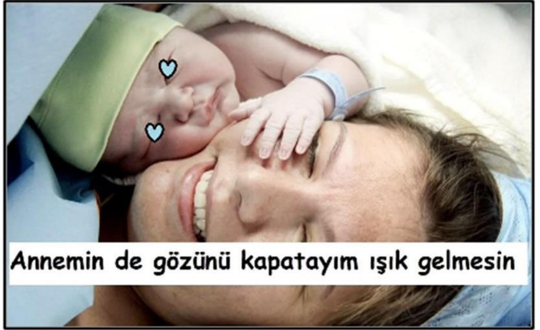
Işık ve Gürültü Yönetimi İçin Uyarıcı Fotoğraflar – 7