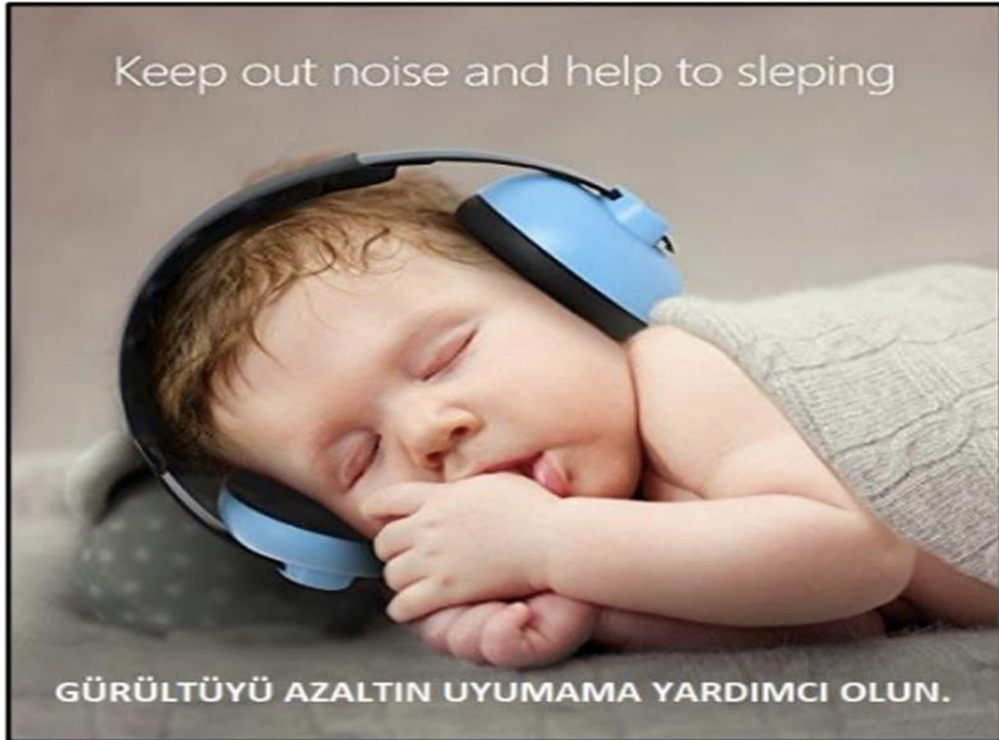
Işık ve Gürültü Yönetimi İçin Uyarıcı Fotoğraflar – 3