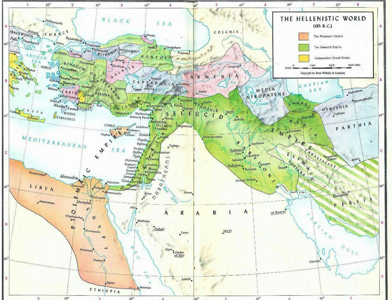
Harita II: Mısır-Helen Devleti (Pitolemeler) ve Suriye Helen Devleti (Selevkiler) Haritası 698