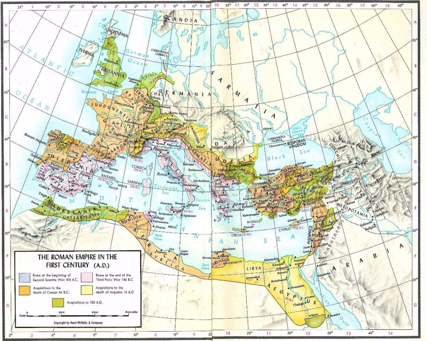
Harita I: Roma İmparatorluğu Haritası 697