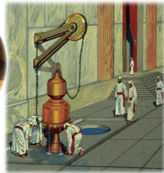
Kohenlerin Temizlik İçin Kullandıkları Yıkama Kazanı

The Copper Laver , (כִּיּוֹר נְחוּשֶׁת), which stands on the southern side of the entrance to the Sanctuary of the Holy Temple, is the first stop for the kohanim each morning, as they sanctify their hands and feet in its waters. The Copper Laver consists of both a laver, (כִּיּוֹר), and its stand, (כֵּן). A second Temple kohen gadol by the name of Ben Katin added a third component to the laver: A muchni , or reservoir, was added to the top of the laver for the purpose of being able to store ritually pure water overnight.