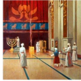
Takdime Ekmeği Masası

The Golden Showbread Table stands along the northern wall of the Kodesh Sanctuary . The table contains twelve shelves which hold twelve loaves of bread. Once a week, on Shabbat , two kohanim enter the Kodesh and replace the twelve loaves of Showbread with twelve new loaves. At the same time two other kohanim enter carrying two censors of frankincense to replace the two censors currently resting of the Showbread Table . As the Torah instructs in Exodus 25:23-30, the table is made of wood, covered with gold.