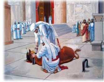
Kohenlerin Kurbanlardan Akan Kanları İçerisine Koydukları Kap Olan Büyük Mizrak

The mizrak is made of either silver or gold.