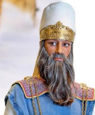
Başkohen Tarafından Kullanılan Altın Taç

"And you shall make a crown of pure gold, and engrave on it in the manner of a signet ring, "Holy to HaShem." (Exodus 28:36) The tzitz was a thin plate of pure, solid gold, worn across the forehead of the kohen gadol, from ear to ear. A second plate of gold fit around the back of the High Priest's head and the two were tied together with woolen threads dyed with sky-blue techelet dye.