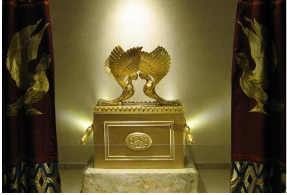
Ahit Sandığı'nın Kopyası