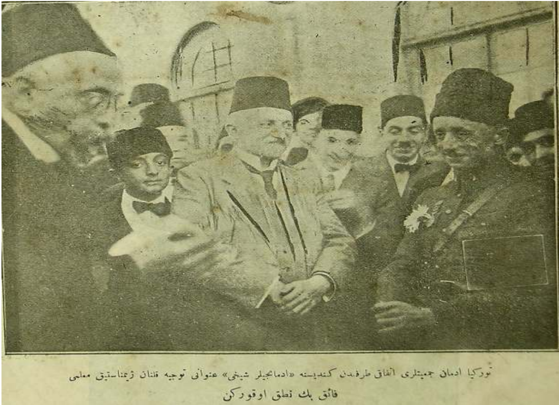
Resim 1. Basında Faik Bey (122)

öğretmenliği yapmış, sayısız sporcu yetiştirmiş ve sonra emekli olmuştur. Ali Faik Bey (Faik Üstünidman) bu sırada 1889 yılında “jimnastik” ya da “Riyazat-ı Bedeniye” isimli ve Türk sporunda yazılan ilk eseri yazmış ve bastırmıştır. Böylece ülkemizde de modern spora geçiş jimnastik ile olmuştur (93). Mekteb-i Sultani’de jimnastik derslerinin uygulanmasıyla birlikte, Osmanlı eğitim sisteminde, beden terbiyesi derslerine bir sivil okul öğrencileri için ilk defa bu derecede önem atfedilmiş oluyordu. Yıl sonlarında da öğrencilerin beden terbiyesi derslerinde edindikleri hüneler, halka açık gösterilerde ortaya koyuluyordu. Bu gösteriler ve beden terbiyesi programı gayrimüslimlerden ziyade Müslüman öğrencileri de beden terbiyesi ve modern sporlarla buluşturduğu için entelektüel kesimden ilgi görüyordu (1). Basında çıkan yazılarda Faik Efendinin becerilerinden ve bu becerilerini öğrencilerine başarıyla yansıttığından övgüyle bahsedilmiş ve Maarif Vekaleti’ne jimnastik derslerinin Avrupa’da olduğu gibi bizde de ilkokuldan başlayarak orta ve liseye kadar okulların programlarına konulmasını ifade etmişlerdir (55).