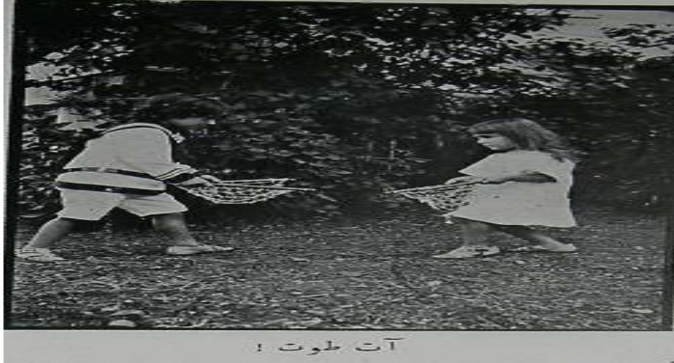
Resim 3. At-Tut Oyunu (84)

Sporun II. Abdülhamid devrinde kitle gösterilerine dönüşebileceği korkusuyla baskı altında tutulduğuna dair yaygın inanışa (27) rağmen, fiziki kültür hareketi, halk sağlığı ve eğitimde önemli katkıları olduğu için bu dönemde güçlenmiş ve yaygınlaşmıştır. II. Abdülhamid döneminde futbol maçlarının da diğer birçok toplumsal faaliyet gibi hafiyeler vasıtasıyla takip edildiği ve sık sık yasaklandığı bilinmektedir. Fakat bu dönemde aynı zamanda Osmanlı sporcularının uluslar arası müsabakalara ilk defa katıldığını görmekteyiz (1). Örnek olarak Avrupa ve Amerika'ya bazı güreşçilerimiz gitmişlerdir. Ünlü güreşçilerimizin bu spor seyahatleri ile uluslar arası alanda spor faaliyetlerine katıldığımız söylenebilir (133). Yine bu dönemde fizik kültür