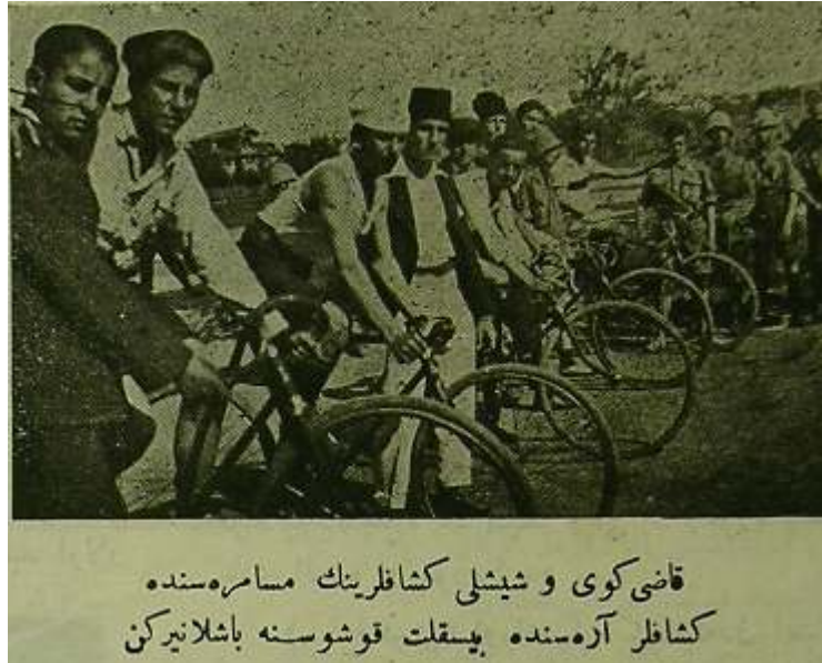
Resim 10. Bisiklet Yarışı Öncesi (58)

Kadıköy ve Şişli Keşşaflarının müsamesesinde Keşşafar arasında bisiklet koşusu yapıldığını dergilerdeki haberlerden öğrenmekteyiz.