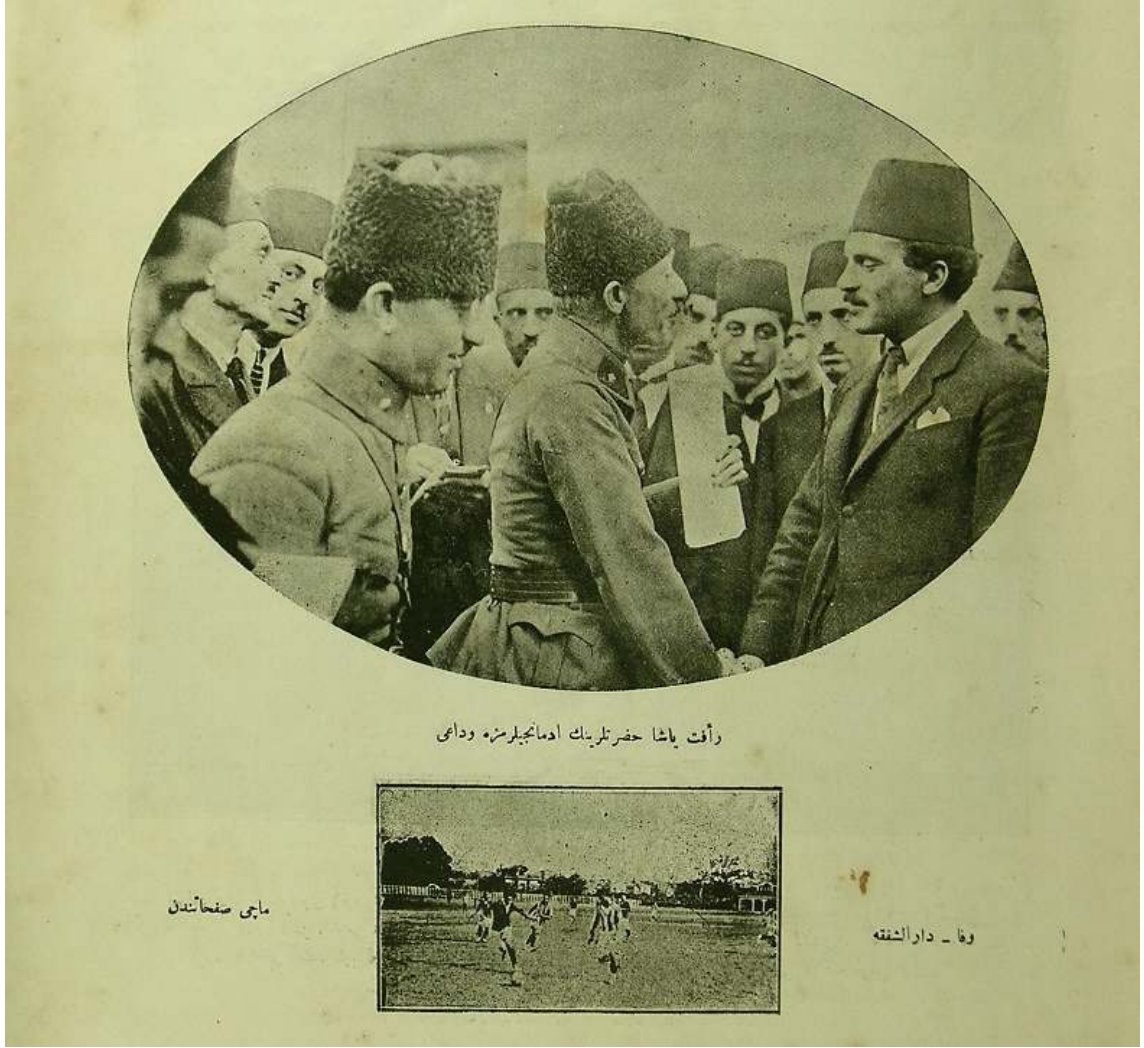
Resim 5. Rafet Paşa Hazretlerinin İdmançılara Vedası / Vefa-Darü'sşafaka Maçı (122)