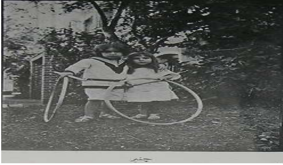
Resim 2. ember Oyunu (84)