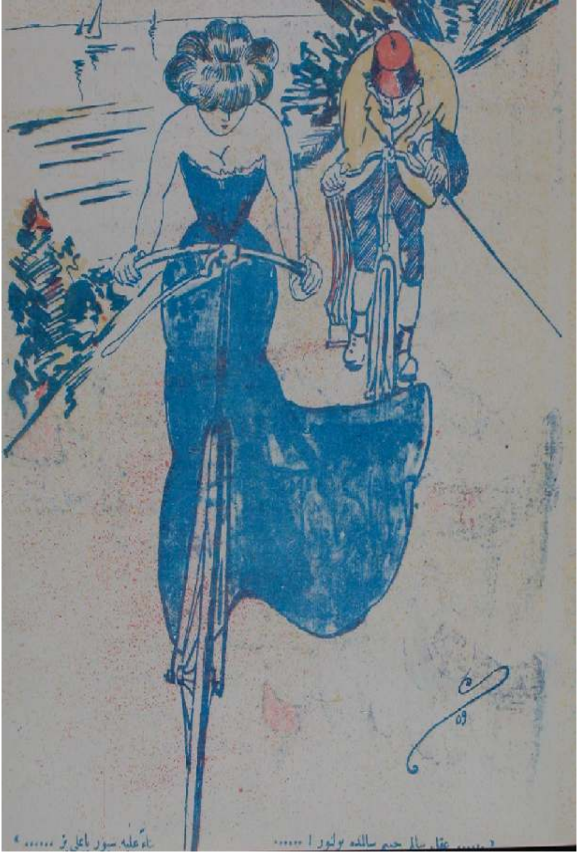
Resim 4. Akıl Salim Cismi Salimde Bulunur-Spor Yapmalıyız (40, 45)