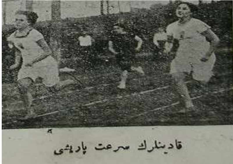
Resim 6. Kadınların Sürat Yarışı (82)

11 Mayıs 1917 tarihinde İttihad Spor Kulübü'nün sahasında yapılan ikinci İdman Bayramında atletizm yarışlarının daha da arttığı görülmüştür. Bu bayramda yüksek atlama, uzun atlama, sırıkla yüksek atlama, cirit atma, disk atma, halat çekme, 100m. sürat koşusu, 800m. mukavemet koşusunda yarışmalar düzenlenmiştir (53). Buna örnek olarak aşağıdaki resimde kadınların sürat yarışını görmekteyiz.