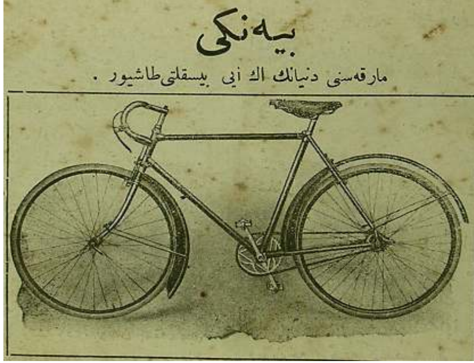
Resim 9. Biyanki Bisiklet Reklamı (58)