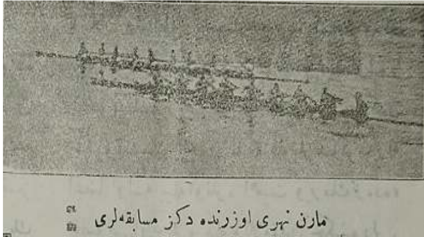
Resim 8. Marn Nehri Üzerinde Deniz Müsabakaları (83)

Paris'te sahaflarda bulunan bir belgeye göre, 1917 yılında savaş ortasında 10 teknenin katılımıyla büyük bir yelken yarışı düzenlenmiştir (51). Yine 1919 yılında Marn Nehri üzerinde Deniz Müsabakaları yapıldığı haberlere yansımıştır.