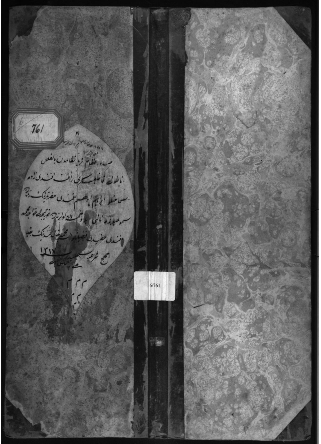
Defterin ilk sayfası