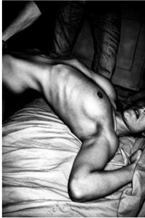
Fotoğraf 34: Anders Petersen, Gap ve St. Etienne Serisinden, 2005

İnsanlara değil; insanlarla bir şeyler yaparım. Birinin fotoğrafçısı olmaktansa birinin yoldaşı olmayı tercih ederim. Sadece tanımlayabildiğim insanları fotoğraflarım; tanımlayabildiğim her türden insanı, tanıştığım her insanı ailemin bir parçası olarak görüyorum. Böylece, Tokyo'da ya da San Francisco'da da olsam yabancılarla tanıştıyormuşum gibi hissetmiyorum; kız ya da erkek kardeşlerimle tanışıyorum. Bir kere bu kavramı anladığımda, sihirli bir etkileşimle tüm sorunların ortadan kalkar. 191