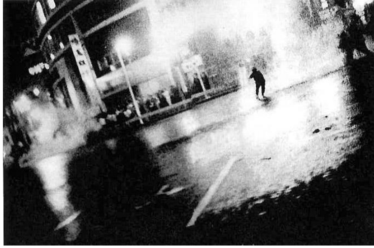
Fotoğraf 22: Daido Moriyama, oct.21,1969, 1969-2010

Kişisel yaklaşımı ve üslubuyla Japon fotoğrafında farklı ve etkileyici bir yere sahip olan Moriyama'nın ilham aldığı isimlerin başında, o olmasaydı fotoğrafa başlamazdım dediği Shomei Tomatsu yer alır; ancak, Uzak Doğu'lu bir fotoğrafçı olarak yüzünü Batı'ya dönen Moriyama, Andy Warhol, William Klein ve Jack Krouac'tan etkilenmiş ve bunu çalışmalarına yansıtmıştır. "60'ların sonunda Warhol'un işlerinin bir kataloğunu gördüm. Onun işlerinde, fotoğrafın kökenine dair bir şeyler gördüm ve etkilendim. Bulabildiğin sıradan nesnelere kullanmak ve onlara erotizm katmak gibi. Ve bu, fotoğrafın temel anlamı olarak düşündüğüm şeye çok yakın." 168 Klein'in, Moriyama'ya ilham veren işlerinin tipik örneği olan ve bulanık görüntüleri, eğik çerçeveleri, farklı açılar ve perspektif kullanımıyla bilinen 1956 tarihli New York kitabıdır. Klein'in erken dönem işlerinden etkilenen Moriyama, Klein hakkında şöyle der: "O fotoğrafların insanları duygulandıracak güce sahip olduğunu fark ettim. Hiçbir zaman fotoğrafların o kadar serin kanlı olabileceğini düşünmemiştim." 169