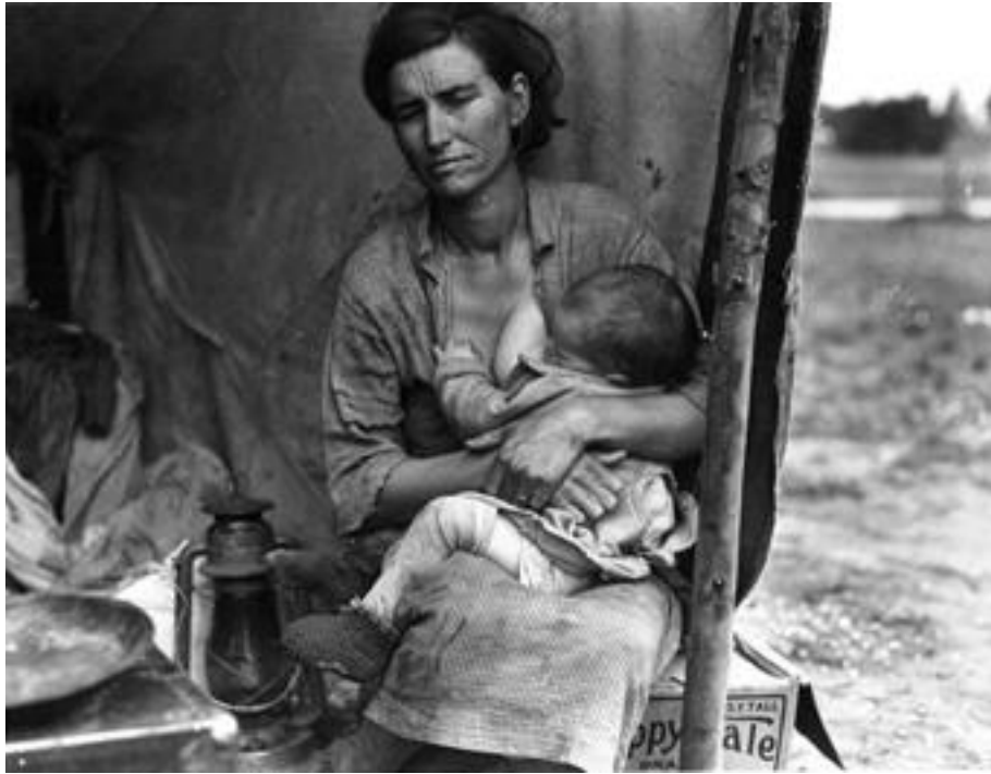
Fotoğraf 54: Dorothea Lange, Göçmen Anne, California, Mayıs, 1936