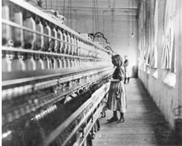
Fotoğraf 2: Lewis Hine, Carolina Pamuk Fabrikasında Çocuk İşçi, 1908

ürettiği saygın fotoğraflarıyla, erken 20. yüzyıl klişesi haline gelen ve çoğunlukla görmezden gelinerek ikinci sınıf vatandaş olarak kabul edilen göçmenlerin ve çocuk işçilerin yaşamlarını kayıt altına alan Hine, fotoğraflarına eşlik eden raporlar yazarak; fotoğraflarının, bir bulmacanın parçaları olduğuna inanır. Hine, 'photo story' adını verdiği, fotoğraflarla oluşturulan hikayenin yazıyla desteklenerek yayınlanmasının yaratıcısıdır. Fotoğraflarla oluşturulan hikayelerin fikirlerle birlikte anlatılmasıyla oluşturduğu düzenlemelerin fazlasıyla ikna edici olacağını düşünür.