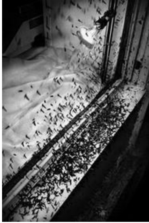
Fotoğraf 33: Anders Petersen, İsimless, Gap ve St. Etienne Serisinden, 2005

“Gerçekliđi tanımlayamam; en fazla, geçerli görünen şeyleri, onları gördüğüm şekliyle, yakalamaya çalışabilirim.” 189 Petersen için fotoğraflar, gerçekleri yansıtmaz, öyle oldukları söylene de, fotoğraflar gerçeklikle ilgili deđildir. Onun için gerçek, kendi gerçekliđidir; duyguları, istekleri, ihtiyaçları, yaraları, geçmişidir. Bu nedenle fotoğraflarının iyi ya da kötü, güzel ya da çirkin olmasıyla ilgilenmez; inanılır olmasıyla ilgilenir. “Fotoğraf insanlarla ilgilidir. Cinsiyetinizle, midenizle ve kalbinizle ilgilidir. Bir başka açıdan bakıldığında iyi ve kötü fotoğraf yoktur. İnanılası fotoğraflar vardır. Her fotoğraf özportrem olmak zorunda. Benim için inanılası olan bu.” 190