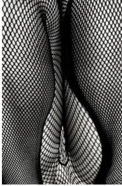
Fotoğraf 26: Daido Moriyama, Nasıl Güzel Bir Fotoğraf Yaratırsın 6: çorap içinde shimotakaido, 1987

Kırk yılı aşkın kariyeri boyunca, düzinelerce fotoğraf üretmesine rağmen Moriyama'nın adı sıklıkla tek bir fotoğrafla anılır. Stray Dog (Sokak Köpeği) isimli, gizemli half-tone sokak fotoğrafında, delici bakışları ve düşük alt çenesiyle kendini savunmaya hazır, büyük siyah bir köpeği gösterir. Bu fotoğrafın ne anlama geldiğine dair birçok tahminde bulunulsa da Moriyama, ona hiçbir anlam yüklemeyiz. "Tohoku'da bir otelde kalıyordum. Otelden çıktım; yürürken bir köpek gördüm ve fotoğrafını çektim. O fotoğrafı çekerken hiçbir şey kastetmedim; sadece çektim. Hiçbir zaman bu kadar ünlü olabileceğini düşünmemiştim." 174