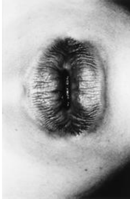
Fotoğraf 19: Nobuyoshi Araki, İsimlessiz, 1993

Eşinin ölümünün ardından Araki'nin fotoğrafları değişir. 70'li yıllarda çok tutucu olduğunu ve sonunda kendine karşı isyan ederek geçmişi yıktığını belirten Araki, kendi deyimiyle, kirli tarafına dokunur ve böylece erotik dünyayı yeniden ziyaret eder. Ürettiği işlerin niteliklerine bağlı olarak Araki'nin fotoğrafları geniş bir yelpazeye yayılır. Ancak, temelde hepsi aşk, cinsellik ve ölüm hakkındadır.