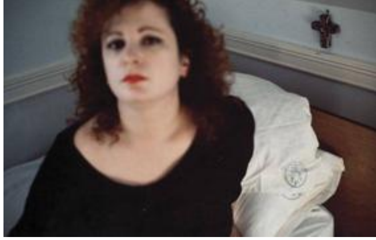
Fotoğraf 13: Nan Goldin, Milagro'yla Otoportre, The Lodge, Belmont, MA, 1988

Şans getirdiğine inandığı objeleri toplayan Goldin'in klinikteki odasında çektiği bu otoportrede duvarda asılı olan haç sanatçının bu zor dönemde kendisine yardımcı olması için yanında getirdiği objelerden biridir. Kliniğin ambleminin yastık kılıfında görünmesi, bu fotoğrafı çektiği anda bulunduğu mekanın bir ispatı; başka bir deyişle, Goldin'in kendi yaşamının her anını saklamadan, olduğu gibi yansıtmalarının bir göstergesidir. Birçok korkunun olduğu, hiçbir şeyin tanıdık gelmediği ve bir tür kimlik krizi yaşadığı bu süreçte, gündüz saatlerinde dışarı çıkmayan Goldin'in yaşadığı tüm üzüntü odasına dolan ışığın içindedir.