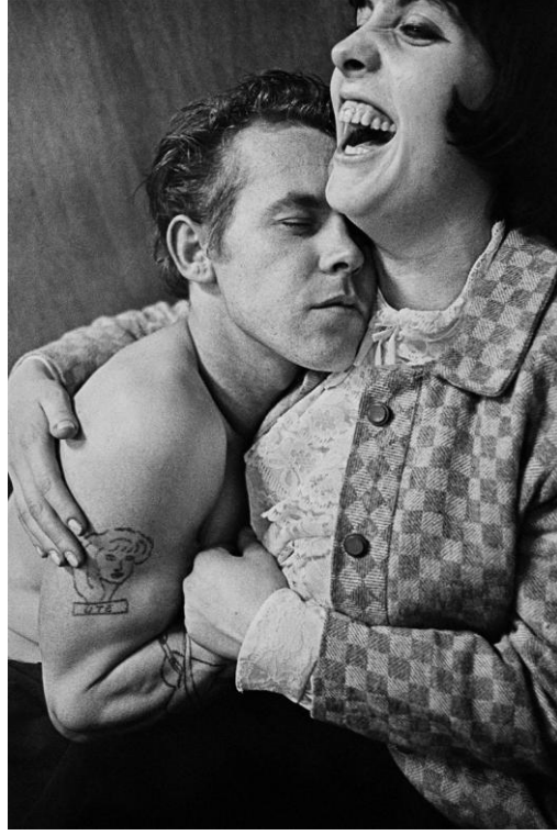
Fotoğraf 29: Anders Petersen, Lily ve Rose, Café Lehmitz, Hamburg, 1967-1970

Petersen'in başyapıtlarından biri olan ve Café Lehmitz'in simgesi haline gelen bu fotoğraf, onun insani yaklaşımını gösteren ve teknik kaygılardan önce 'kritik duyguyu' ön plana alarak, izleyiciye ezber bozduran bir dil yaratacağının ilk habercisidir. Ataerkil kodlamalarla fotoğrafa bakan izleyici için kadın-erkek rollerinin tersine çevrildiği bir anın duygusunu aktaran bu fotoğrafın gücü Petersen'in yaklaşımından ileri gelmektedir. "Café Lehmitz'deki insanların, bende olmayan, etkileyici bir görünüşleri ve samimiyetleri vardı. Umutsuz olmak, hassas olmak, yalnız başına oturmak ya da başkalarının arkadaşlığını paylaşmak normaldi. Bu yoksul yerde muhteşem bir sıcaklık ve hoşgörü vardı." 181 İsveç'e döndükten sonra fotoğraflarını kitaplaştırmak isteyen Petersen, yayıncıların, kimsenin fahişelerin fotoğraflarına bakmak istemeyeceğine dair yorumlarından ötürü, olumsuz bir yanıtla karşılaşır. İsveç'te ciddiye alınmayan fotoğraflarını 1977 yılında Fransa'nın Arles şehrinde düzenlenen aynı adlı fotoğraf festivaline götürür. Arles'in baş küratörlerinden biri Petersen'in, Café Lehmitz fotoğraflarıyla ilgilenir ve onları