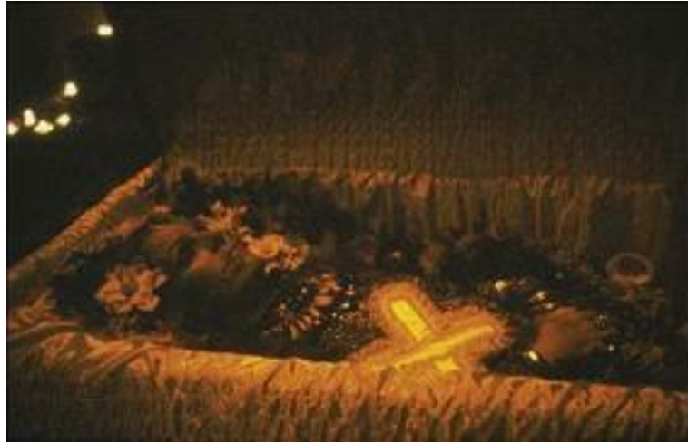
Fotoğraf 10: Nan Goldin, Cookie Tabutunda, New York, 15 Kasım, 1989

“Eskiden, insanları yeterince fotoğraflarsam onları asla kaybetmeyeceğimi düşünürdüm. Aslında, fotoğraflarım bana, ne kadar çok kaybettiğimi düşündürüyor. Fotoğraflarım benim günlüğüm; insanları okuyabildiğim.” 148