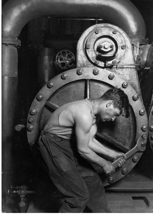
Fotoğraf 52: Lewis Hine, Buhar Pompası Üzerinde Çalışan Tamirci, 1920

Lewis Hine, fotoğrafların anlayış göstererek yorumlandığında sosyal koşulların değişmesine katkıda bulunacağına inanan bir fotoğrafçıdır. Bu yaklaşımla gerçekleştirdiği işçi portrelerinde, onları merkeze oturttükçe yüceltir ve onurlandırır. Buhar pompası üzerinde çalışan bir işçiyi gösterdiği bu fotoğrafta, genel algı koşullanmalarıyla bir işçiden beklenen görüntü, çalışmaktan yorgun düşmüş, üstü başı kir içinde bir profil çizmesiyken Hine, yaklaşımıyla bize bunun aksini gösterir. Merkeze yerleştirilen işçi, kaslı kollarıyla ve yaptığı işe konsantre olan ifadesiyle gücü elinde bulunduran bir görüntü çizer.