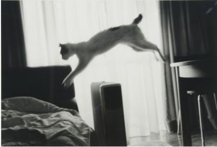
Fotoğraf 50: Nobuyoshi Araki, Sentimental Journey (Duygusal Yolculuk), Spring Journey (Bahar Yolculuğu) Serisinden

Kritik anın yakalanması tüm fotoğraflar için temel bir unsur olarak kabul edilmektedir; ancak Petersen'in deyimiyle, bir kritik an vardır; bir de kritik duygu. Bu iki unsur bir araya gelmelidir; çünkü fotoğraflar duygularla ilgilidir. Fotoğrafçı, gözlemci pozisyonundayken kritik anı yakalayabilir; ancak kritik duyguyu yakalayabilmek için odanın içinde olmak gereklidir. Fotoğrafçı, kendi duygularını fotoğraflarına aktarabildiği ölçüde, o fotoğrafın içindedir; fotoğrafçının, isteklerini, özlemlerini, yaralarını, 'kendisini'; başka bir deyişle fotoğrafçının özportresini o fotoğrafın içinde görebiliriz.