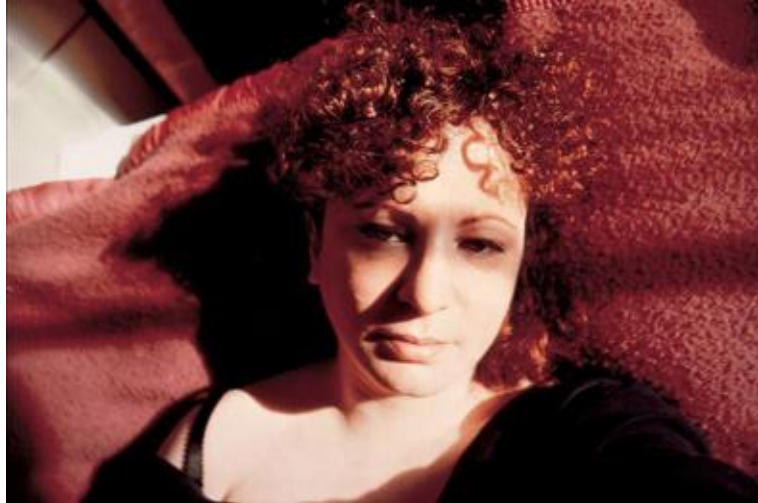
Fotoğraf 14: Nan Goldin, İçe Dönük Gözlerle Otoportre, Boston, 1989

Şans getirdiğine inandığı objeleri toplayan Goldin'in klinikteki odasında çektiği bu otoportrede duvarda asılı olan haç sanatçının bu zor dönemde kendisine yardımcı olması için yanında getirdiği objelerden biridir. Kliniğin ambleminin yastık kılıfında görünmesi, bu fotoğrafı çektiği anda bulunduğu mekanın bir ispatı; başka bir deyişle, Goldin'in kendi yaşamının her anını saklamadan, olduğu gibi yansıtmalarının bir göstergesidir. Birçok korkunun olduğu, hiçbir şeyin tanıdık gelmediği ve bir tür kimlik krizi yaşadığı bu süreçte, gündüz saatlerinde dışarı çıkmayan Goldin'in yaşadığı tüm üzüntü odasına dolan ışığın içindedir.