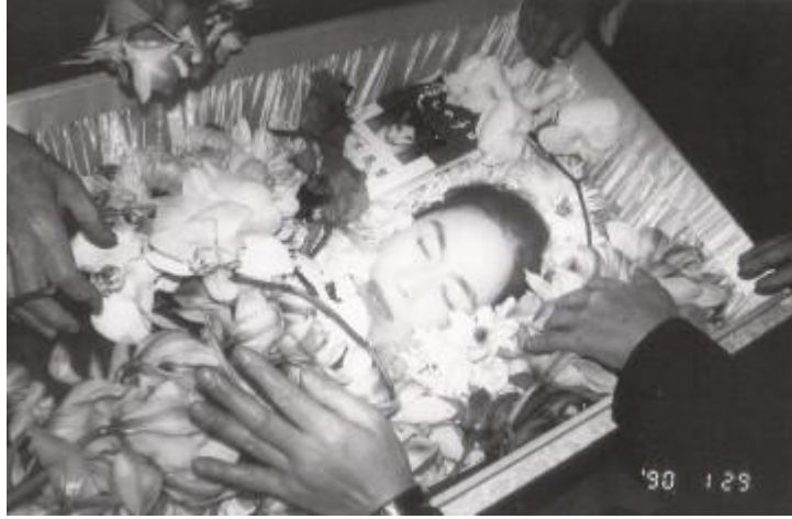
Fotoğraf 17: Nobuyoshi Araki, Winter Journey (Kış Yolculuğu), 1989-1990