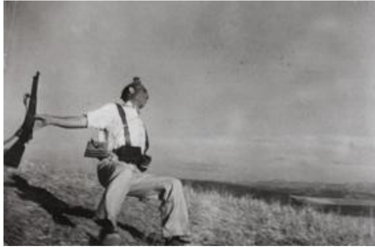
Fotoğraf 4: Robert Capa, Cumhuriyetçi Bir Askerin Ölümü, İspanya, 1936

1936'da fotoğrafladığı, İspanyol İç Savaşı'nda, sivil savaşa yerle bir olan ülkenin görüntüleriyle savaşın gereksizliğini vurgulayan Robert Capa, bakış açısında tarafsızlığını koruyamaz. Onun tarafı savaşa karşı durmaktır. Savaşın simgesi haline gelen ünlü fotoğrafı 'Cumhuriyetçi Bir Askerin Ölümü' 23 Eylül 1936'da Vu'de, Ekim'de Regards'da ve Temmuz 1937'de Life'da yayınlanır. Yarattığı etkiyle, Capa'nın isminin önüne geçen bu fotoğraf, gerçekliğiyle ilgili bir çok tartışmaya konu olsa da, ölümün doğrudan anlatımı ve savaşın saçmalığının sembolü olarak insanlığın görsel tarihinde yerini alır. London Illustrated News ve Berliner Illustrierte, İspanyol İç Savaşı'yla ilgili önemli konulara yer verir. Dünya, bu savaşın yaklaşan büyük savaşın habercisi olduğunu hisseder. Aynı zamanda, Life'da, Çin, Habeşistan, İtalya ve Sovyetler Birliği'ndeki karışıklıklarla ilgilenir. II. Dünya Savaşı kapıdadır.