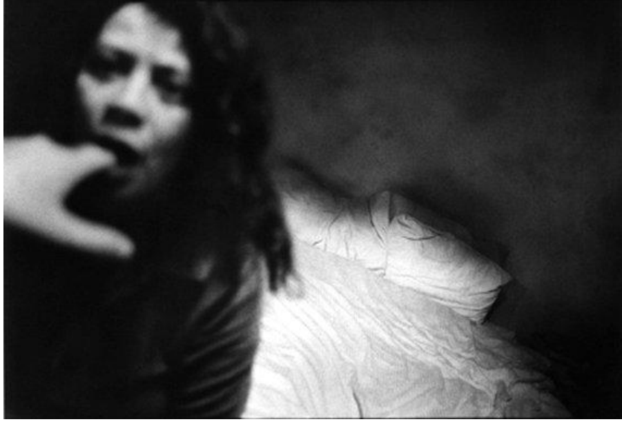
Fotoğraf 58: Anders Petersen, Close Distance (Yakın Mesafe) Serisinden, 2002

Petersen'in Close Distance serisine ait bu fotoğrafta, görece net olan yatak ilk bakışta dikkati çekerken sonrasında rolünü karanlık ve bulanık kısma bırakmaktadır. Kadının yüzündeki ifadesizlik ve fotoğrafa sürpriz bir şekilde dahil olan elin pozisyonu izleyicide büyük bir soru işareti oluşturur. Kadın, ardında bıraktığı kendi yaşanmışlığının izlerini taşıyan dağınık yataktan, aydınlıktan; gizemli elin sahibi tarafından hipnotize edilmişçesine, naif bir hareketle, teslim olarak karanlık alana çekilir. Gizemli el, kapladığı alanın küçüklüğüne rağmen, kadının üzerinde yarattığı etkiyle fotoğrafın ruhunu tamamen ele geçirir.