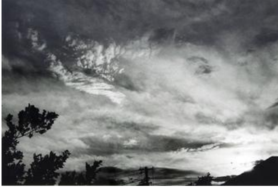
Fotoğraf 55: Nobuyoshi Araki, Sentimental Journey (Duygusal Yolculuk), Spring Journey (Bahar Yolculuğu)